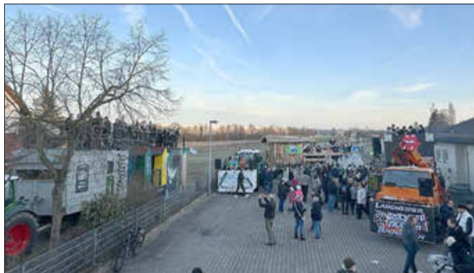
Die drei Faschingswägen präsentierten sich auf dem Hof des Feuerwehrhauses.

Der Faschingswagen der Feuerwehr Langweid kann noch bei folgenden Umzügen besichtigt werden: Nachtanzzug Asbach-Bäumenheim (28.02.), Welden (01.03.), Rain am Lech (02.03.) und Gablingen (04.03.)