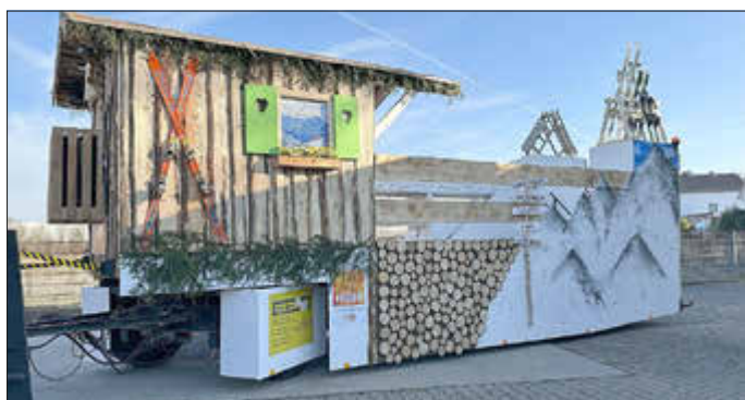
„Aprés Ski“ lautet das diesjährige Faschingsmotto bei der Freiwilligen Feuerwehr Langweid.