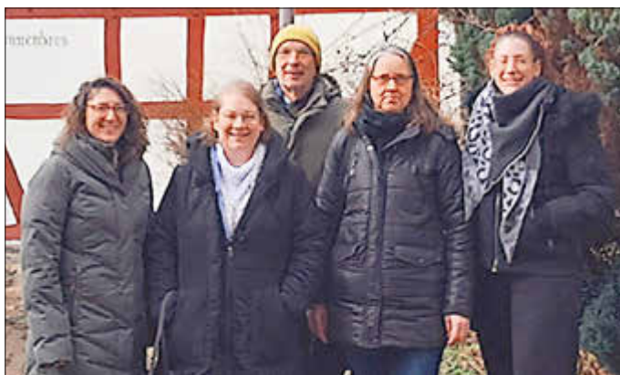
Das GenoEifel-Team steht ab sofort mit zusätzlichen Sprechzeiten in Hönningen zur Verfügung.

HÖNNINGEN. Vergangene Woche trafen sich die Mitarbeiter der GenoEifel mit Frau Monreal vom Quartier 3 in Hönningen. Dabei wurde festgestellt, dass beide Projekte sich sehr gut ergänzen und unterstützen können. Die Zusammenarbeit mit Quartier 3 ist ein weiterer Schritt, um die Gemeinschaft zu stärken und den Austausch zwischen den verschiedenen Akteuren, und vor allem den Bürgern vor Ort, zu fördern.