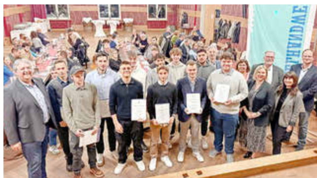
Für 13 junge Männer beginnt nun die Gesellenzeit im Handwerk.