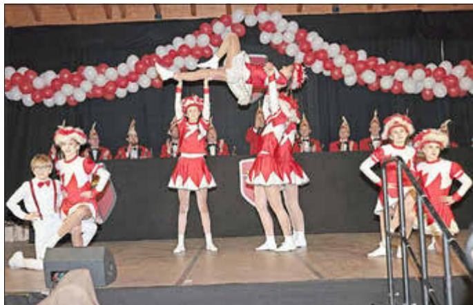
Die „Rote Funken“ begeisterten als jüngste Garde der KG-Familie.