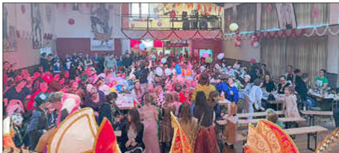
Der Kinderkarneval war gut besucht.