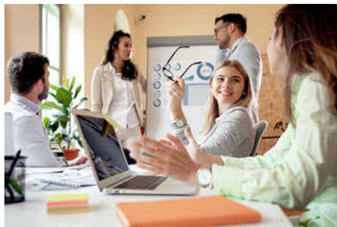
Angehende Bankazubis sollten Kontaktfreude und Kommunikationsstärke mitbringen.