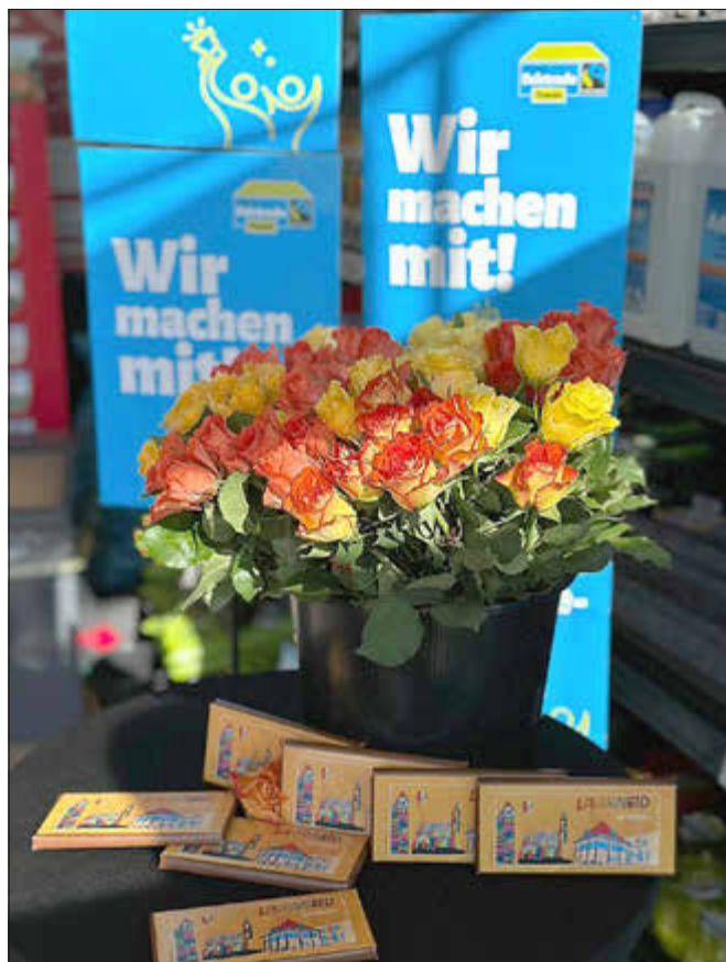
Faire Rosen und die faire Langweid – Schokolade

Sprecherin der Steuerungsgruppe Fairtrade Langweid