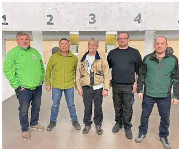
Die gablinger Sportpistolen bleiben in der Oberliga

Nun bekommen die Schützen aus Nordendorf 2 Mannschaftspunkte und 1 Mannschaftspunkt bleibt in Gablingen. Somit war der vorletzte Tabellenplatz gesichert und der Abstieg abgewendet.