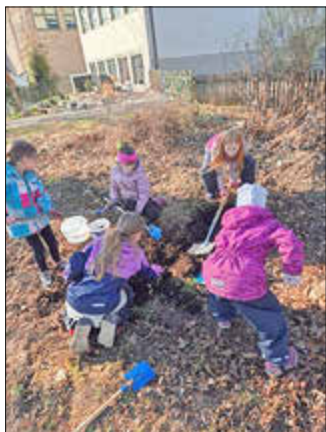
Emsiges Arbeiten im Schulgarten

setzten Blumen aus dem alten Gartenbereich. Auch der Bau einer Kräuterschnecke aus alten Backsteinen konnte bereits begonnen werden.