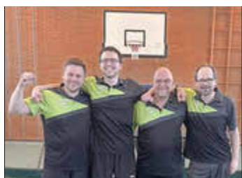
Aufstieg 1. Mannschaft der Tischtennisabteilung des VfL Osterspai