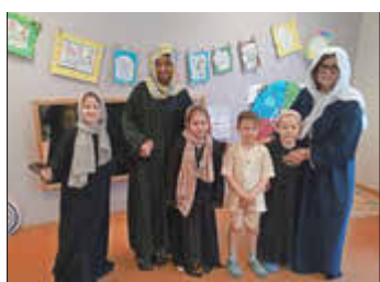
Interkulturelle Projektarbeit bei der Kommunalen Kita Regenbogenhaus Osterspai/Filsen