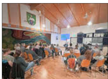
Auftaktveranstaltung zur Schaffung von Arbeitsgruppen in Bornich