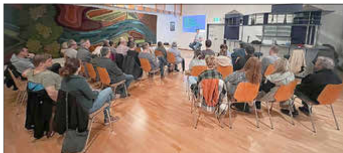
Viele Bornicherinnen und Bornicher kamen letzte Woche in den Gemeinderaum, um sich über die Schaffung der Arbeitsgruppen zu informieren.

Am 25.03. fand im Gemeinderaum die Auftaktveranstaltung zur Gründung von Arbeitsgruppen statt. Mehr als 30 interessierte Bornicherinnen und Bornicher nahmen an der Veranstaltung teil, und ich konnte den aufmerksamen Zuhörern den Grundgedanken hinter dem Vorhaben und die einzelnen Arbeitsgruppen vorstellen. Anschließend wurden Anmeldezettel verteilt, um das Interesse an der Mitarbeit in einer oder mehreren Arbeitsgruppen zu bekunden. Mit mehr als 25 abgegebenen Zetteln und circa 40 Kreuzchen bei verschiedenen Arbeitsgruppen war die Veranstaltung ein voller Erfolg.