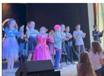
Kidstreff auf großer Bühne

Jahrgang 14 | Nr. 14 | FREITAG, 04. April 2025