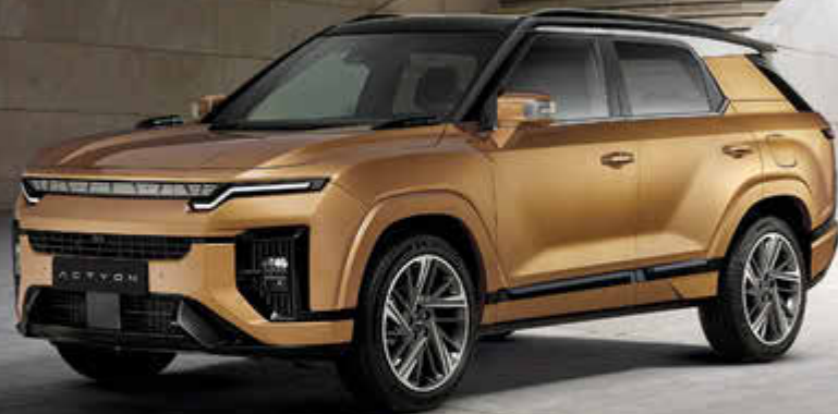
Abbildung enthält aufpreispflichtige Sonderausstattungen.