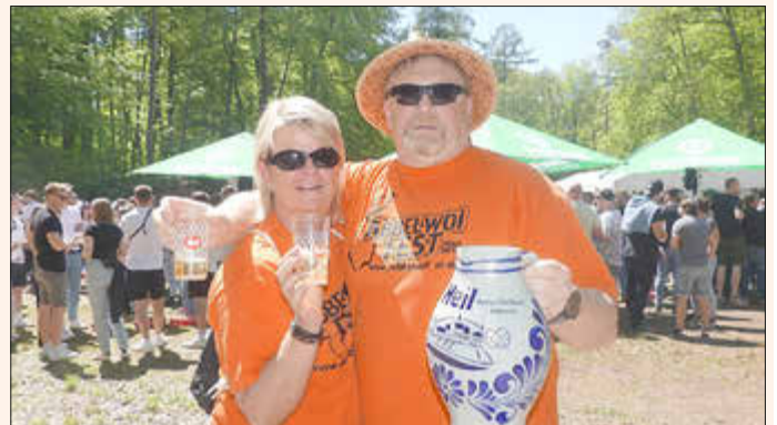
Was bleibt, ist Dankbarkeit: Für all die wunderschönen Jahre, die vielen treuen Besuchern, die fröhlichen Gesichter, die Musik, das Miteinander, das Anstoßen mit dem „guude Stöffche“ – alles Erinnerungen, die uns niemand nehmen kann.