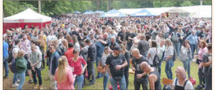
Das Äbbelwoifest in seiner ganzen Pracht im Jahr 2019.