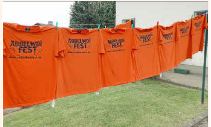
Alles hat seine Zeit- die Zeit des Äbbelwoifestes in L.E. ist nun leider vorbei.