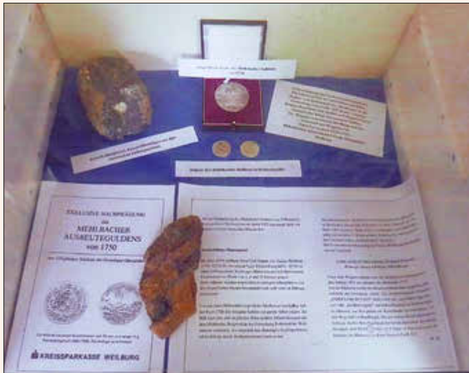
Blick in die Ausstellung mit dem 1750 geprägten „Mehlbacher Gulden“

Telefon: 06472/7921, email: metzler-rohnstadt@gmx.de, info: www.rohnstadt.de