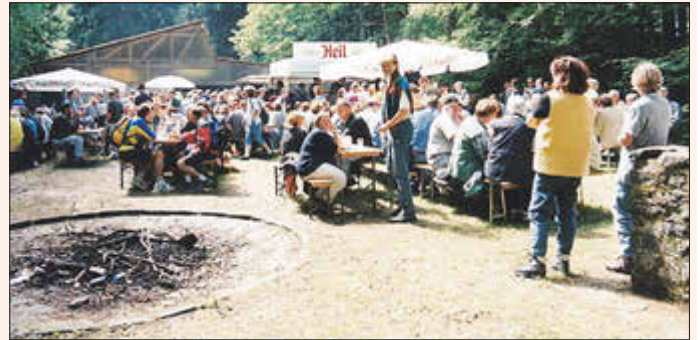
Das 2. Äbbelwoifest, „noch in den Kinderschuhen“, im Jahr 2000.