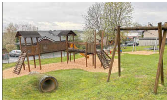
Der Spielplatz in Dünebusch

Ein besonderer Fokus lag auf der Pflege der örtlichen Spielplätze. Neue Hackschnitzel wurden an und unter den Spielgeräten verteilt, um den wichtigen Fallschutz zu gewährleisten. Die Spielplätze in Dünebusch und Bitzen sind nun wieder für alle Kinder zugänglich – was sowohl für die jüngsten Gemeindeglieder als auch für ihre Eltern eine große Freude ist.