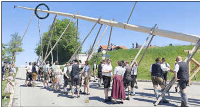
Aufstellen des Nußdorfer Maibaums

Nur durch die Hilfe vieler fleißiger Hände konnten die Zuschauer bestens mit Schmankerln vom Grill, Kaffee und Kuchen sowie anderen kulinarischen Köstlichkeiten versorgt werden.