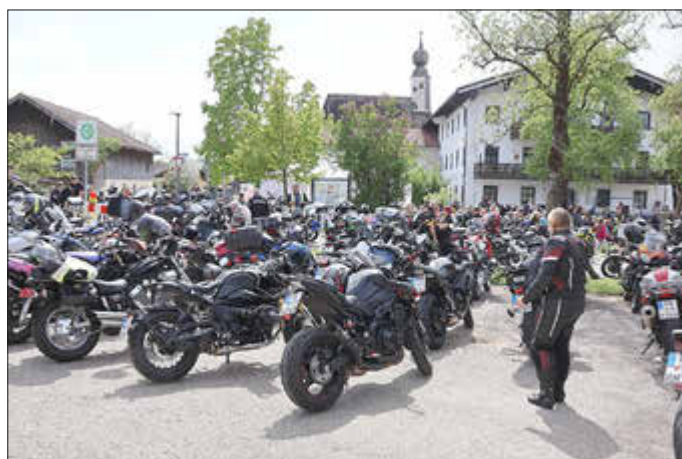
Über 250 Motorradfahrer kamen zur Motorradweihe nach Sondermoning, 182 nahmen an der Rundfahrt teil.