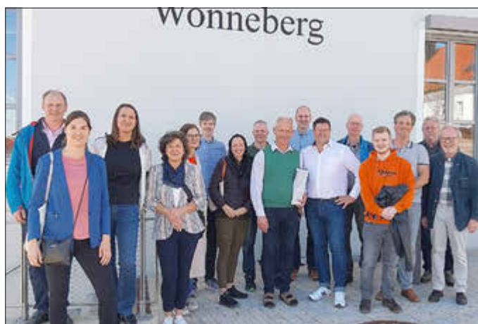
Bürgerrat und Gemeinderat auf Exkursion. Wonnebergs Bürgermeister Martin Fenninger (Mitte, grüner Pullover) stellte das Wonneberger Bürgerhaus und die Neugestaltung der Dorfmitte vor.

Die gewonnenen Eindrücke und Anregungen werden in die weiteren Planungen zur Zukunft der „Alten Schule“ in Nußdorf einfließen – ganz im Sinne einer aktiven, gemeinschaftlichen Dorfentwicklung.