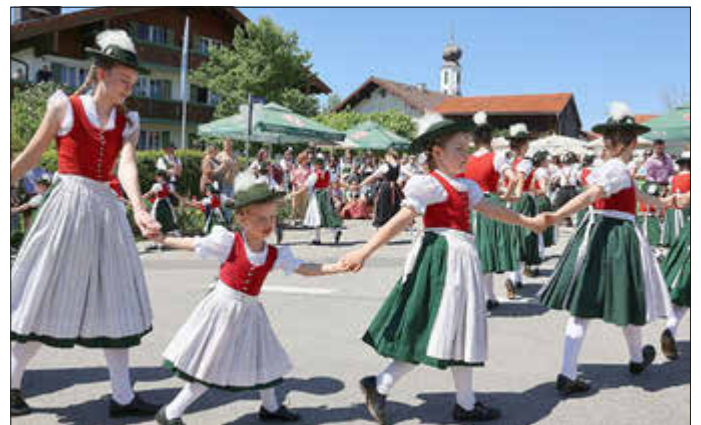
Die Kinder- und Jugendgruppe des Trachtenvereins unterhielt die mehreren Hundert Besucher mit Tänzen und Plattlern.