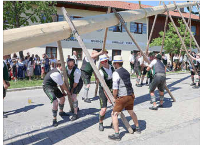
Gemeinsam und mit Schwaiberl stellten die Nußdorfer Trachtler mit den Maibaumdieben des Burschenverein „Edelweiß“ Hart auf

belohnten die Zuschauer die muskelstarke Aufstelltruppe als das hölzerne Prachtstück seine endgültige Lage erreicht hatte. Danach wurden die Taferl und Figuren mit Hilfe eines Kranes angebracht. Für die musikalische Unterhaltung während des Aufstellens sorgte die Musikkapelle Nußdorf und die Kinder- und Jugendgruppe des Trachtenvereins präsentierte ihr Können mit Volkstänzen und Plattlern. Die Spitze des Nußdorfer Maibaumes zierte übrigens wieder ein kupferner Wind- und Wetterhahn. Das Gartenfest am Bürger- und Vereinsheim mit dem der neue Maibaum gefeiert wurde, dauerte bis weit in die Abendstunden. pv.