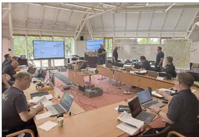
Arbeit der Technischen Einsatzleitung im Stabsraum in der Kreisverwaltung