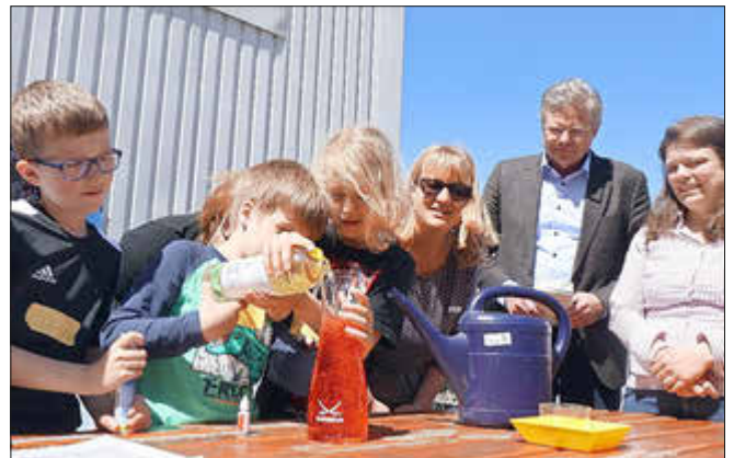
Kinder aus dem Betreuungsangebot zeigen dem Ersten Kreisbeigeordneten Peter Neidel ein Experiment zur Herstellung von Flüssigkeit für eine Lavalampe.