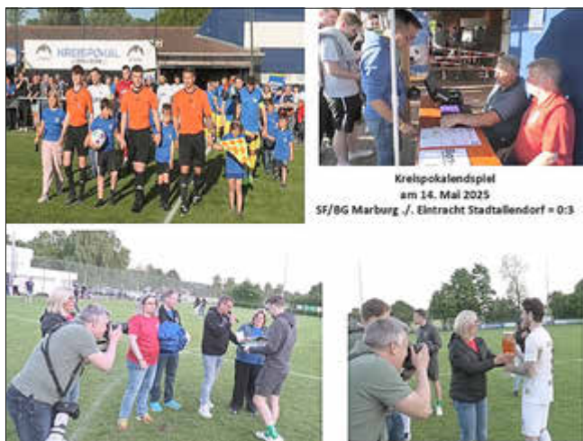
Kreispokalspiel am 14. Mai 2025 SF/BG Marburg / Eintracht Stadtallendorf = 0:3

SF/BG Marburg - Eintracht Stadtallendorf