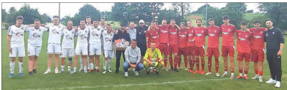
Die Verabschiedeten, Geehrten und Ausgezeichneten im Kreise beider Seniorenmannschaften und des Vorstandes

Mittwochabend, 19 Uhr, warme Temperaturen, sehr gute Platzverhältnisse und ca. 350 Zuschauer, die dem Endspiel zwischen den SF/BG Marburg und dem Hessenligisten Eintracht Stadtallendorf. Die Organisation hatte der TSV Wohratal zusammen mit dem Kreisfußballausschuss übernommen. Zahlreiche TSV-Helfer, die die Ankommenden auf Parkplätze verwiesen, die zusammen mit Personen der beiden Vereine die Kassen besetzten, die Zuschauerinnen und Zuschauer mit Grillwürstchen,