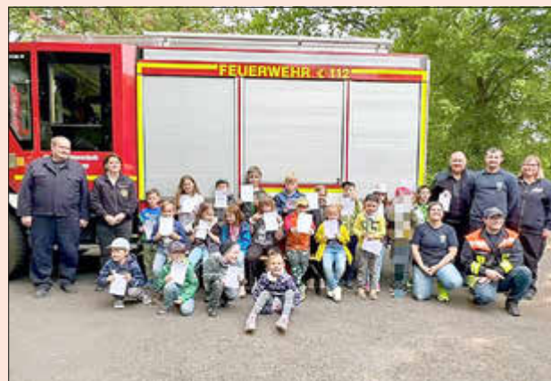
Sichtlich stolz zeigen die Kinder der Kinderfeuerwehren aus Halsdorf und Wohra ihre Urkunden.

Ein großer Dank geht an die fleißigen Helfer und Unterstützer, ohne die es dieses Mal nicht so herrlich nach frischen Waffeln ge-rochen hätte und die zu einem reibungslosen Ablauf beigetragen haben. Besonderer Dank gilt dem Lettcheshof für die frischen Eier und dem Hof Herbst für die frische Milch, ohne diese wären die Waffeln nur halb so gut geworden.