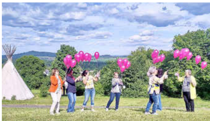
Die Initiative für Alleinerziehende im Westerwald schickt (biologisch abbaubare) Ballons in den Himmel, um die gute Nachricht vom Comeback der Allize-App in den Westerwald zu tragen.

Mitte Mai feierte die Allize-App, die sich vorwiegend an Alleinerziehende im Westerwald richtet, ihren offiziellen Neustart.