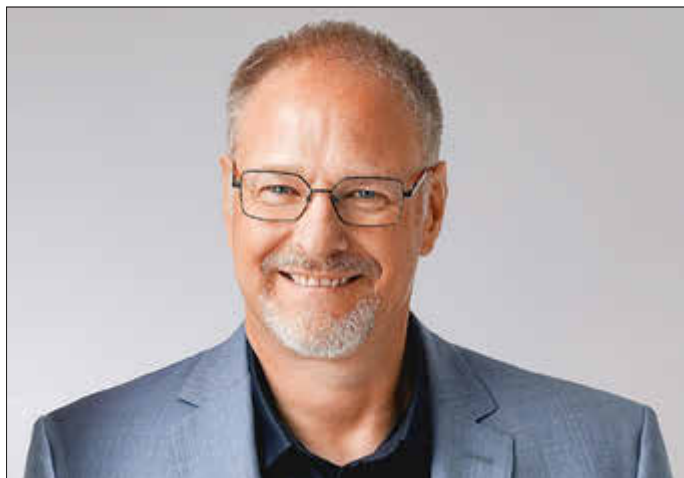
MdB Harald Orthey

Der CDU-Bundestagsabgeordnete Harald Orthey freut sich, dass das Infomobil des Deutschen Bundestages vom Pfingstmontag 09. bis Mittwoch, 11. Juni 2025 in seinem Wahlkreis 203 Station macht. Der 17 Meter lange und 26 Tonnen schwere Promotion-Truck wird auf dem Bahnhofsplatz in Montabaur aufgebaut sein.