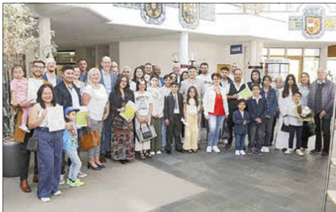
Landrat Volker Boch mit den neuen deutschen Staatsbürgerinnen und Staatsbürgern nach der Überreichung der Einbürgerungsurkunden

oder per Mail an einbuengerung@rheinhunsrueck.de .