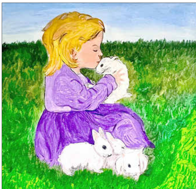
Das Flüstern der Kaninchen