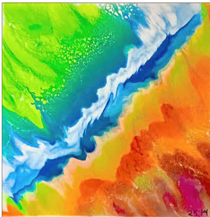
Im Zauber des Licht's 2

Zur Eröffnung laden die Künstler herzlich ein. Sie stehen für persönliche Gespräche zur Verfügung, geben Einblicke in ihr Schaffen und freuen sich auf den Austausch mit interessierten Gästen.“