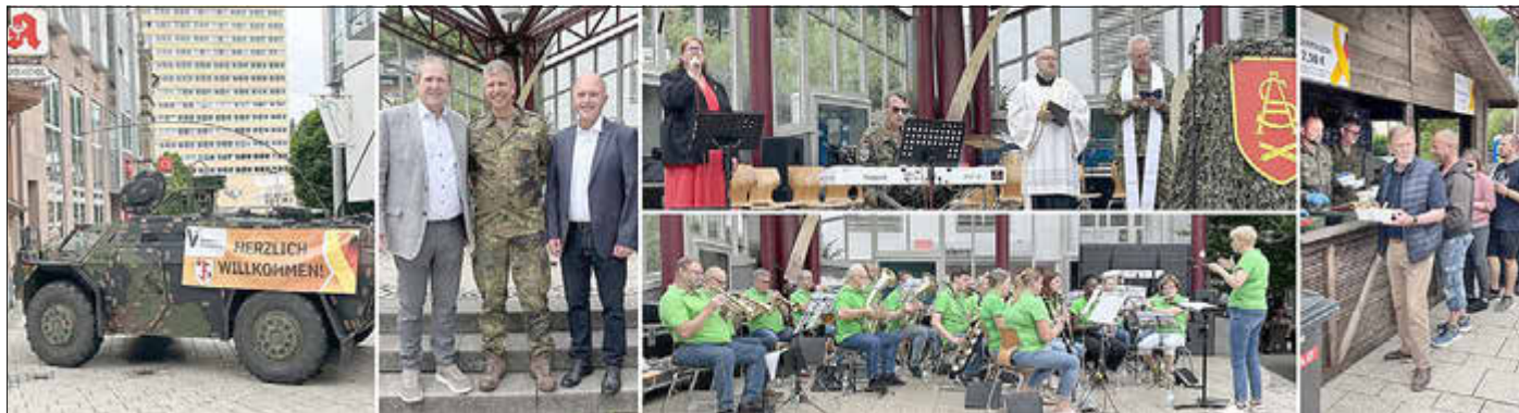
Mit einem Bürgerfest feierten Artillerieschule und Stadt Idar-Oberstein den ersten Nationalen Veteranentag.

Bundeswehrgarnison und die Wiege der Artillerie des Deutschen Heeres. Der Standort ist bekannt für das partnerschaftliche Verhältnis zwischen den zivilen und militärischen Dienststellen sowie der Bevölkerung und den Soldaten. Seit 1988 besteht zudem eine Partnerschaft der Stadt zur Artillerieschule.