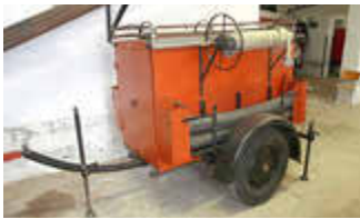
Alte Tragkraftspritze – dem TS 600 sehr ähnlich - im Feuerwehrmuseum Grethen.

1945 nahmen 17 Einwohner die Arbeit in der Freiwilligen Feuerwehr wieder auf. Sie mussten sich an erster Stelle um die Reparatur und Beschaffung von Technik und Ausrüstung kümmern. Eine Jugendfeuerwehr gründete sich 1950. Ihre Mitglieder richteten als erstes eine TS (Tragkraftspritze) 600 her.