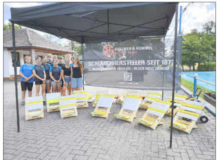
Liegestühle aus Feuerwehrschläuchen

Als am Freitag die Teilnehmer aus den elf Jugendfeuerwehren anreisten, schien die Sonne und blieb auch das gesamte Wochenende. Die 88 Teilnehmer, ihre Betreuer und Helfer bezogen ihr Quartier in großen Zelten. Nach einem gemeinsamen Appell, bei dem auch jeweils zwei Gäste der Stadtverwaltung Sonnewalde und der Amtsverwaltung Kleine Elster anwesend waren, ging es natürlich erst einmal baden.