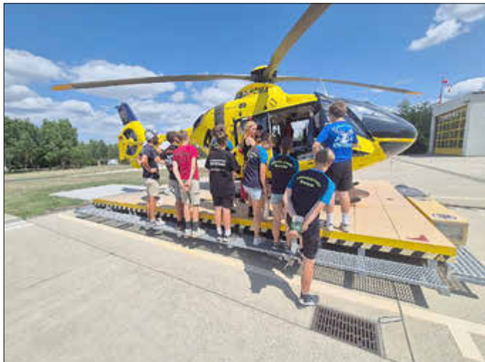
Kennenlernen des ADAC Hubschraubers

aching durch Crinitz. Dazu gab es Spielangebote und natürlich ausgiebiges Baden sowie leckeren Kuchen den liebe Muttis, Omis oder Kameradinnen gebacken hatten.