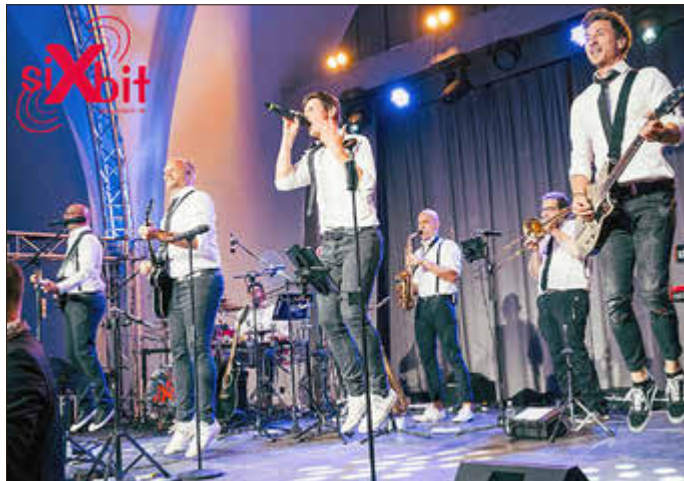
„SixBit“ rocken die „Löschparty“ der Freiwilligen Feuerwehr Bell.

Ab 20:00 Uhr rocken „SixBit“ das Jubiläum. Darüber hinaus sorgen ein Foodtruck und eine Sektbar für kulinarische und flüssige Genüsse. Ab 22:00 Uhr wird mit einem Feuerwerk vom Weltmeister der Himmel illuminiert.