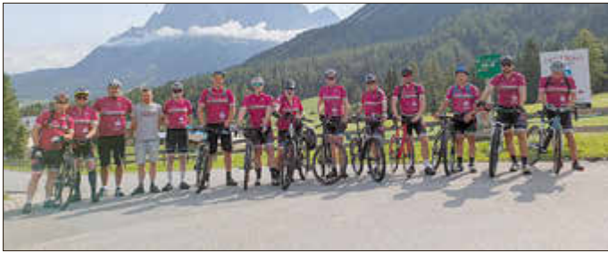
Die Flusstourer des RSC Mayen am Start in Biberwier mit Blick auf die Zugspitze

Anfang August startete eine 17-köpfige Gruppe des RSC Mayen zur jährlichen Flusstour-Etappenfahrt nach Süddeutschland. Mit der „Isar-Tour“ 2016 war die Region schon einmal Ziel, allerdings warteten diesmal neben der Isar noch drei bislang unbekannte Flüsse.