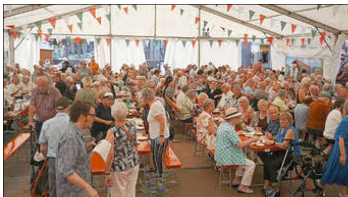
Der Seniorenachmittag beim Stein und Burgfest erfreut sich immer hohe Beliebtheit

Auch in diesem Jahr lädt die Stadtverwaltung Mayen wieder alle Mayener Senioren und Seniorinnen am Nachmittag des 12. September zu Kaffee und Kuchen und einem bunten Unterhaltungsprogramm zum 74. Stein- und Burgfest ein.