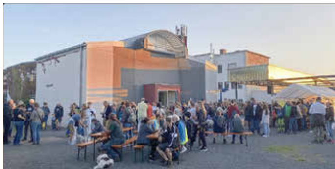
Die Besucher der BatNight warten gespannt auf den Beginn der geführten Wanderung

Mayen. Am Samstag, den 30. August, lädt der NABU Rheinland-Pfalz zur jährlichen BatNight im Mayener Grubenfeld ein. Diese Veranstaltung ist Teil der Internationalen Nacht der Fledermäuse, die jedes Jahr am letzten Augustwochenende weltweit veranstaltet wird. Fledermausfreunde und Naturliebhaber aus der Region und darüber hinaus sind herzlich eingeladen, an diesem besonderen Ereignis teilzunehmen.