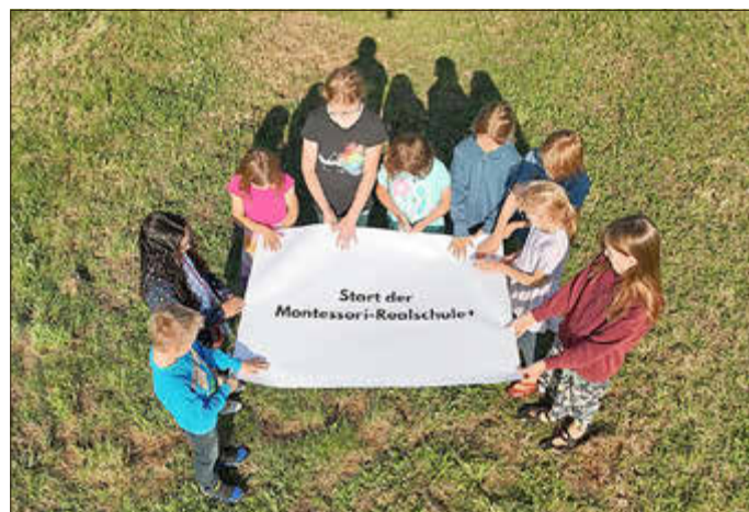
Neue Montessori-Realschule+ in Polch startet

Kurz vor Beginn des neuen Schuljahres kann der Trägerverein der neuen Montessori-Realschule+ verkünden, dass die neue Schule die offizielle Schulgenehmigung erhalten hat.