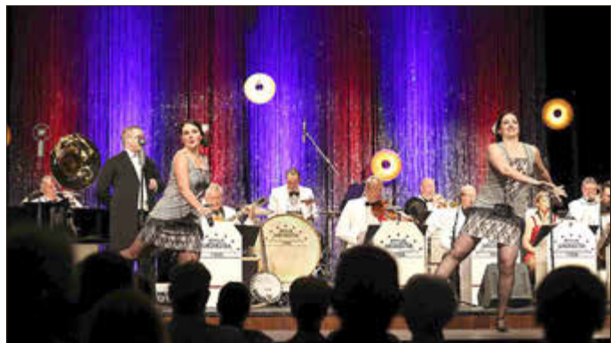
Die Gäste des Seniorennachmittags der Verbandsgemeinde Mendig dürfen sich über eine Revue der „Goldenen 20er“ freuen.