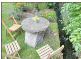
„Offener Stammtisch der Mendiger Grünen“