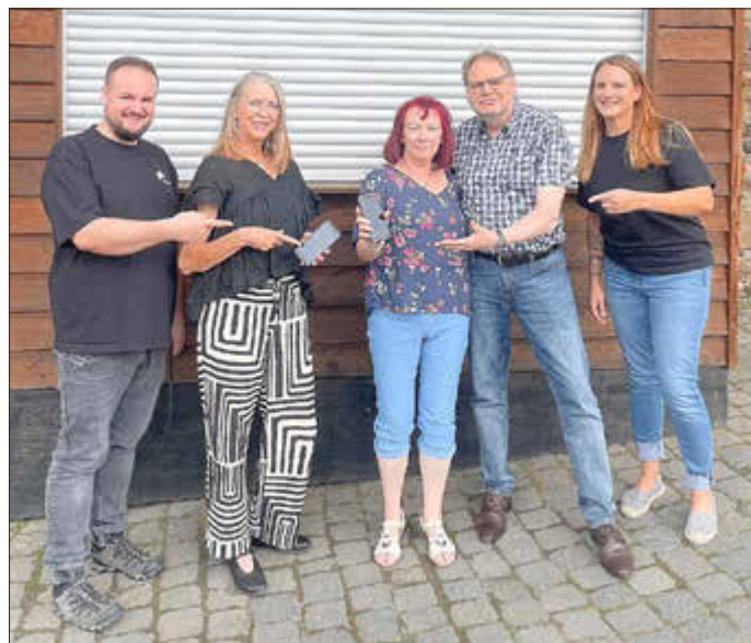
Neue Handscanner machen den Besuch bei den Burgfestspielen jetzt noch entspannter

Die neue Lösung passt sich nahtlos dem aktuellen Ticketsystem an und dient als sinnvolle Ergänzung zu den bestehenden Prozessen. Besucherinnen und Besucher profitieren von einem schnellen, unkomplizierten Entwerten der Tickets - ein reibungsloser Start in den Abend, der Wartezeiten reduziert und den Eintritt in einen schönen Theaterabend angenehm macht.