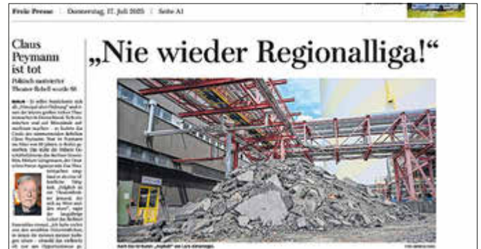
(Screenshot aus der Onlineausgabe der Freien Presse vom 17.07.2025 Seite A1)

Ich habe dazu mal einen Screenshot der Freien Presse vom 17.07.2025 gemacht.