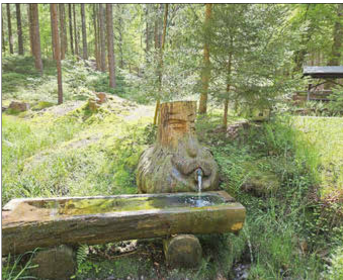
“Wie nennt sich dieses Brunnlein?”

Wer glaubt die richtige Lösung zu wissen, meldet sich telefonisch (0151-12 123 884), per E-Mail (ortsverein-langenberg@t-online.de oder auf anderem Wege bei mir bis zum 15. September 2025.