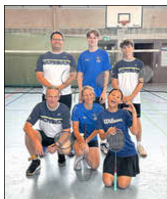
4. Mannschaft in Neustadt

Unsere neu gegründete 4. Mannschaft trat am Samstag auswärts in Neustadt an. Von Beginn an wurde um jeden Punkt gekämpft, und wir haben bis zum letzten Schlag alles gegeben.