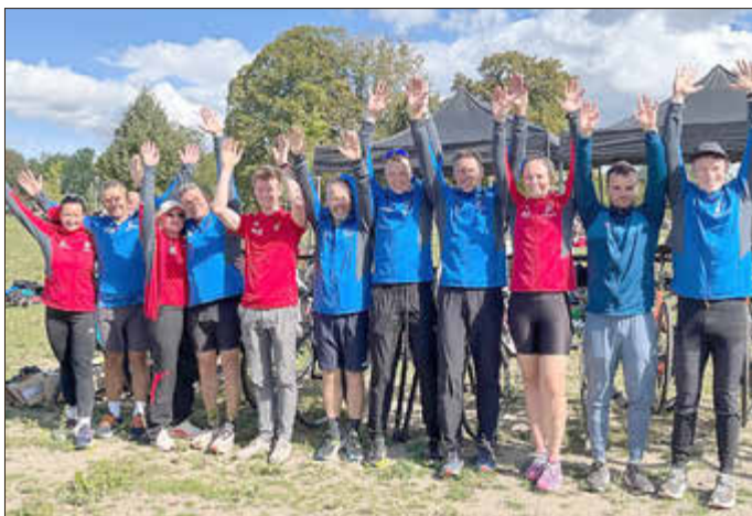
Mehr als das Ergebnis zählte das Erlebnis für die Teilnehmer der LG Hopfen.

Am Ende war das Ergebnis Nebensache, die LG platzierte sich im buntgemischten Feld ganz ordentlich, das Frauenteam und das erste Männerteam belegten in der Wertung „über 120 Jahre“ jeweils den vierten Rang.