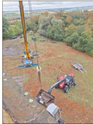
Schwere Technik kam bei den Arbeiten zum Einsatz.

lichen Anzeigen blieben bisher ohne Erfolg. Inzwischen war der Zustand so schlecht, dass sich die Ver-