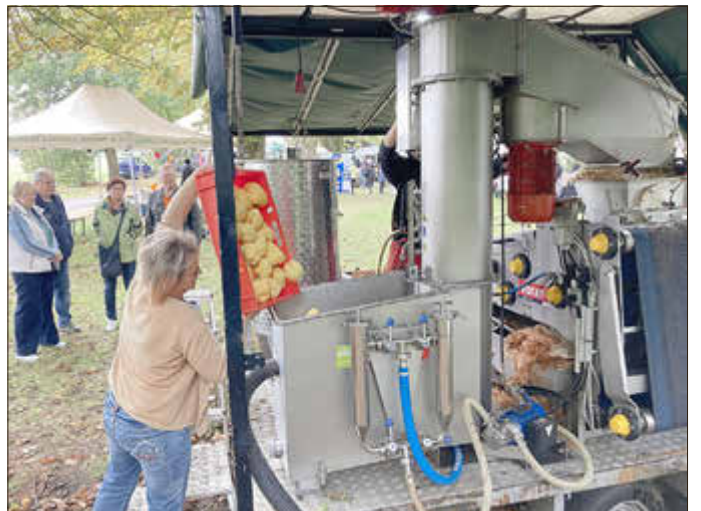
Am 11. Oktober schneppert sie wieder: Die Saftpresse kommt zum Streuobstfest nach Bornstedt. Ab sofort sind Anmeldungen möglich.

Partie. Produkte der Au-leber Obstmanufaktur, selbst gemachte Marmeladen und Tees ergänzen den Reigen ebenso wie ein Stand, der das Herstellen von Pflanzenkohle und von Dörrobst demonstriert. Jedermann ist herzlich eingeladen, der Eintritt ist frei.