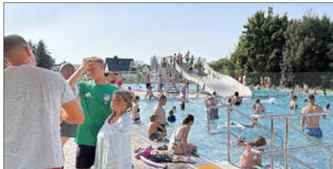
Das Niederndodeleber Familiensportbad wurde auch in der zweiten Saison nach der Modernisierung gut frequentiert.

Schwimmpass wurden abgenommen. Schwimmkurse selbst wurden nicht angeboten.