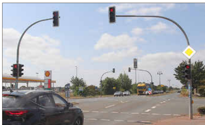
In einem der späteren Bauabschnitte wird auch die Kreuzung L47/ Berliner Allee in Hohenwarsleben grundhaft erneuert.