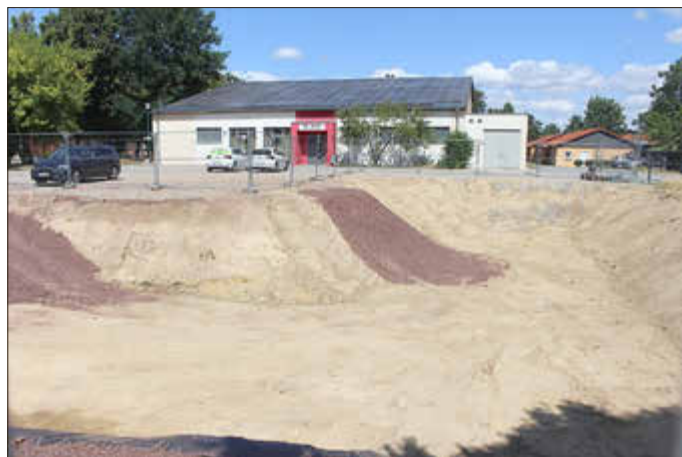
Dort, wo jetzt neben der Prokon-Halle noch eine Baugrube ist, wird schon bald ein Feuerwehrhaus entstehen.

Bauzeit wird es auf dem Gelände erneut Einschränkungen beim Parken geben.