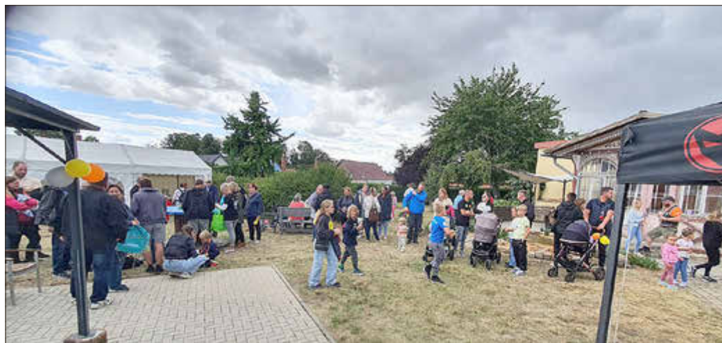
Ein Blick in unseren Gemeindegarten, wo die Essenstände und das Festzelt aufgebaut waren.