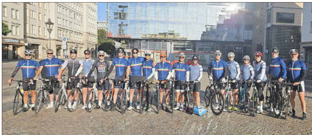
Zufrieden blickt die Radgruppe der LG Hopfen auf die Cycle-Tour zurück.