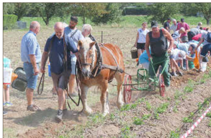
Das Kartoffelfest blickte in diesem Jahr auf eine 20-jährige Tradition zurück.