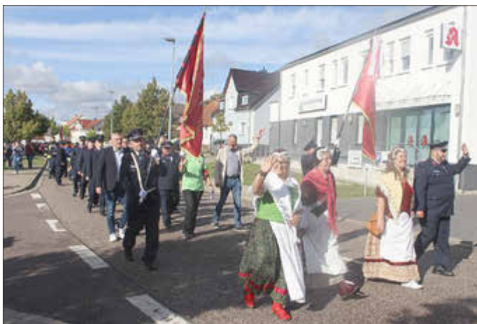
Der Umzug am Sonntagmorgen lockte viele Menschen aus den Häusern.