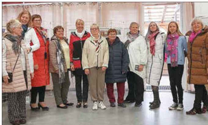
Die Models stehen schon in den Startlöchern, um Mode für die kühlere Jahreszeit zu präsentieren.

Im Anschluss haben die Gäste Gelegenheit, selbst zu stöbern und vielleicht das eine oder andere neue Lieblingsstück für den eigenen Kleiderschrank zu entdecken.