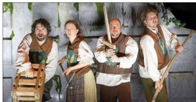
Das Theaterstück „Rausch der Freiheit“ widmet sich dem Bauernkrieg, der vor 500 Jahren ausbrach.

Am Samstag, 18. Oktober 2025, um 20 Uhr startet im Stadttheater Idar-Oberstein das städtische Abo-Programm 2025/26 mit dem Stück „Rausch der Freiheit“. 500 Jahre nach dem Bauernkrieg erzählt das Chawwerusch Theater darin eine Geschichte von Aufbruch, Wut und Hoffnung. Im Zentrum steht der Wunsch nach Gerechtigkeit. „Freiheit“ steht auf den Fahnen der Aufständischen. Ein Gedanke, ein fliegender Funke ist in der Welt. Das Stück, geschrieben von Jean-Michel Rüber, folgt diesem Funken, der bis heute nie mehr erlosch.