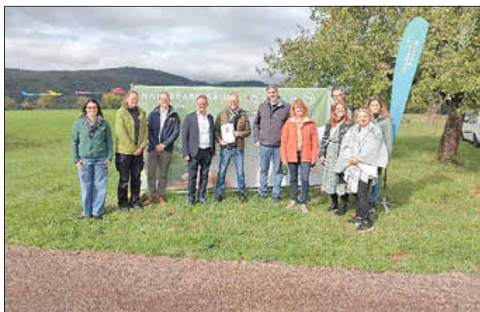
Förderbescheidübergabe durch die SGD Nord an den Naturpark Saar-Hunsrück für das Projekt „Naturpark-Bäume mit und für Alle“ bei Hofgut Serrig *freie Nutzung im Kontext dieser Pressemeldung Foto: ©NPSH*

Im Rahmen der Kick-Off-Veranstaltung gestalteten Schülerinnen und Schüler der Realschule Plus Saarburg erste Nistkästen und Insektenhotels, die auf dem Gelände direkt einen Platz fanden. Langfristig soll die Fläche zu einem außerschulischen Lernort entwickelt werden, an dem Workshops, Pflanzaktionen sowie Bildung für nachhaltige Entwicklung für Kinder, Jugendliche und Erwachsene angeboten werden.