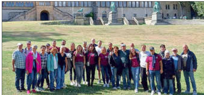
Die Reisegruppe vor der Kaiserpfalz

Auch hier lernten wir neue, interessante Fakten und durften spannenden Geschichten lauschen. Natürlich blieb zwischenzeitlich auch genügend Zeit für gesellige Runden, gemeinsame Mahlzeiten oder auch private Erkundungen der Stadt.