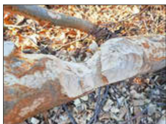
Biberspuren bei Hermeskeil

Der Naturpark Saar-Hunsrück lädt Lehrkräfte am Samstag, 29. November 2025, von 09:30 bis 16:30 Uhr zur Fortbildung der Naturpark-Akademie „Neues Naturerlebnis-Konzept für Biber im Naturpark - Biber & Balance: Wie Natur uns nachhaltiges Leben lehrt“ nach Hermeskeil ein. Im Mittelpunkt stehen eine Exkursion in den Pflanzgarten Hermeskeil mit Spurensuche am Biberlebensraum sowie praxisnahe Methoden für den Unterricht - vom „ Biberrucksack “ bis zur Verknüpfung mit den 17 Nachhaltigkeitszielen (SDGs) und der Bildung für nachhaltige Entwicklung (BNE) .