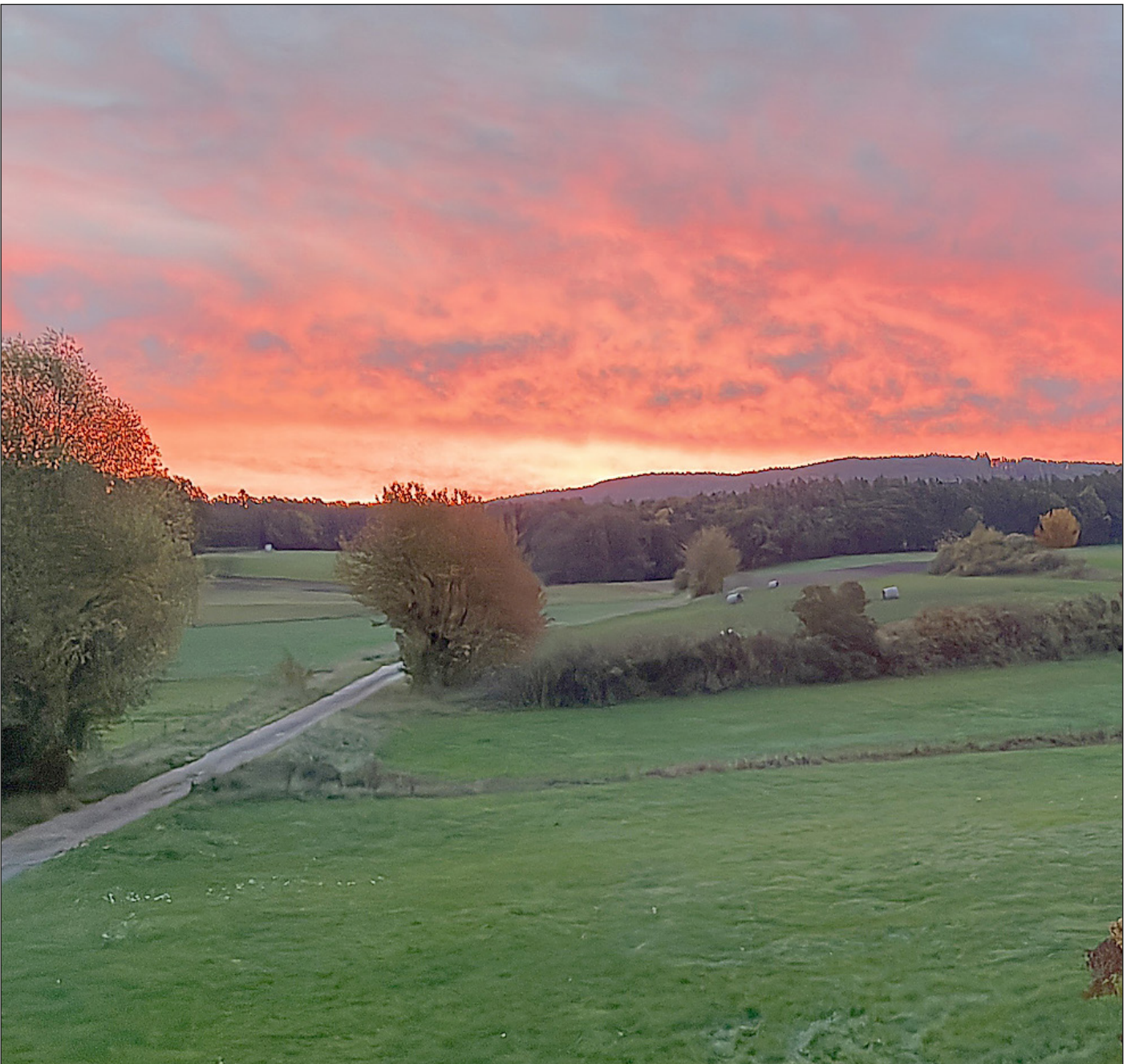
Sonnenaufgang in Untersambach