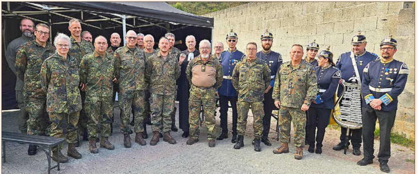
Teilnehmende des GFG

Im Anschluss absolvierten die Reservistinnen und Reservisten ihren KLF-Marsch durch das Weital, auch mit dem Gedanken, sich bei Marschieren auszutauschen. Zu guter letzt wurden sie wieder bei Bratwurst und dem ersten Glühwein der Saison zurückempfungen. Ein großes Lob und herzlichen Dank an alle, die diese Veranstaltung möglich machen und die Tradition aufrechterhalten.