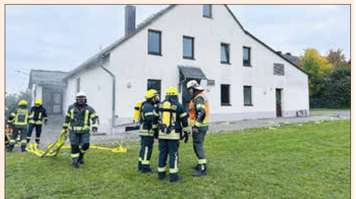
Alarmübung im DGH Dietenhausen