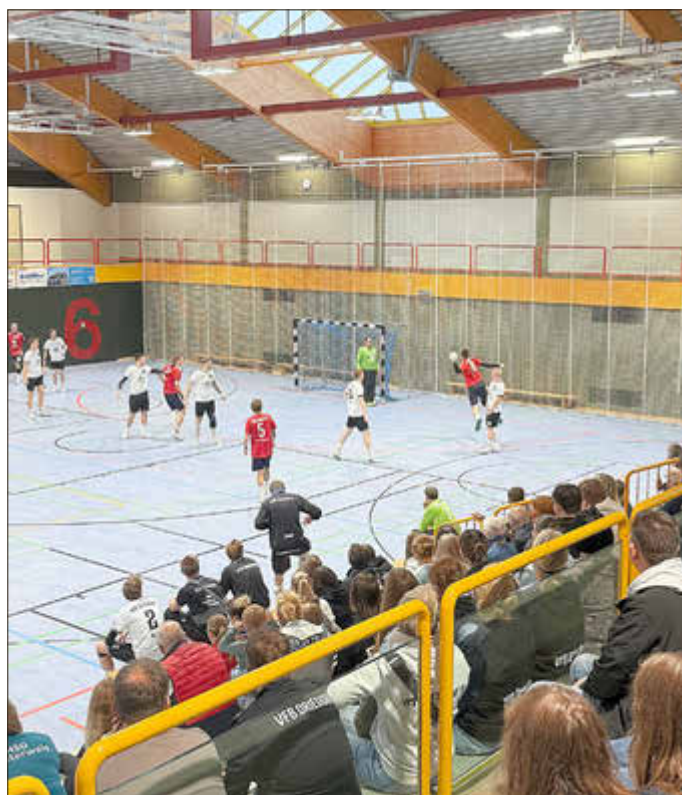
Der Heimspieltag am 02.11. war gut besucht (Foto: Spiel der Herren I).