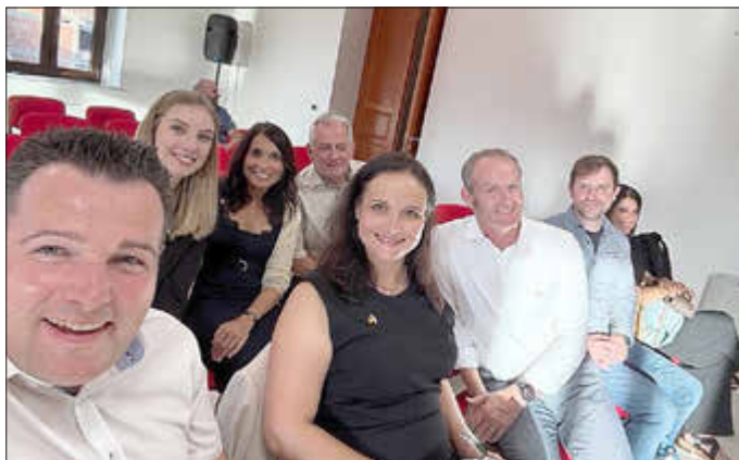
Ein Besuch der Stadtratssitzung fand ebenfalls statt.

Neben dem DIF-Abend stehen unter anderem ein Empfang im Rathaus, Besuche in den Ortsteilen, gemeinsame kulturelle Veranstaltungen, der Volkstrauertag in Fremersdorf mit einer gemeinsamen Messe sowie Ausflüge in die Region auf dem Programm. Der Besuch soll dazu beitragen, die neu geschlossene Freundschaft weiter mit Leben zu füllen und neue Kontakte zwischen Vereinen, Hilfsdiensten, Gewerbe, Schulen und Familien zu knüpfen.