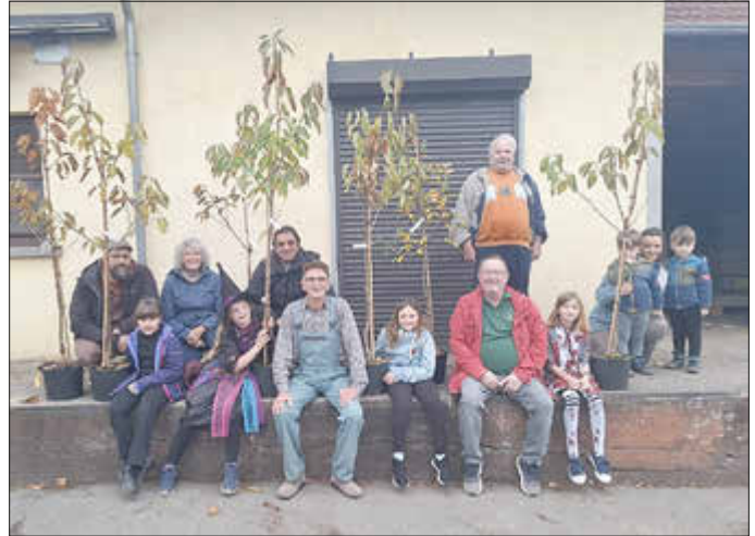
Schulkinder, Mitglieder des Vorstandes und Gäste

Mit diesem Projekt verbinden wir den Wunsch, bereits in jungen Jahren das Interesse an der Ausgestaltung und Erhaltung der Gartenkultur und der Pflege der Kulturlandschaft zu wecken und damit die Vielfalt von Gehölzen in Hausgärten und Streuobstwiesen zu fördern. Wir wünschen den Kindern, dass ihre Bäumchen sich prächtig entwickeln und sie sich mit Freude an ihren Schulbeginn erinnern.