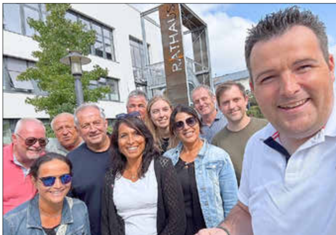
Ab 10. November bis 16. November 2025, dürfen wir nun eine 24-köpfige Delegation aus Santa Caterina in unserer Gemeinde begrüßen

Mit der Unterzeichnung des Partnerschaftsvertrags mit Santa Caterina Villarmosa setzt Rehlingen-Siersburg ein weiteres Zeichen für Europa im Kleinen: für Freundschaft, Verständigung und eine gelebte europäische Gemeinschaft über Landesgrenzen hinweg. Mit den Partnerschaften mit Bouzonville und Santa Caterina Villarmosa macht sich Rehlingen-Siersburg, das im Herzen Europas liegt, stark für den europäischen Gedanken. Die Gemeinde bedankt sich daher bei allen, die sich in den letzten 50 Jahren für diese Freundschaften eingesetzt haben.