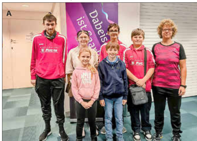
Siersburger Nachwuchsspieler & Trainerteam Vielen Dank für die Organisation und Betreuung vor Ort.

Dieses internationale Badminton-Turnier lockte Spieler und Fans aus aller Welt in die Saarlandhalle. Es war ein Tag voller spannender Matches, bei dem die Zuschauer die Gelegenheit hatten, die besten Badminton-Spieler der Welt, z.B. Jonatan Christie und Mia Blichfeldt, live zu erleben. Neben den sportlichen Highlights war es auch eine großartige Gelegenheit, Autogramme der Badminton-Elite zu bekommen. Der Ausflug bot allen Beteiligten nicht nur die sportliche Unterhaltung, sondern auch eine Gelegenheit, als Gruppe zusammenzukommen.