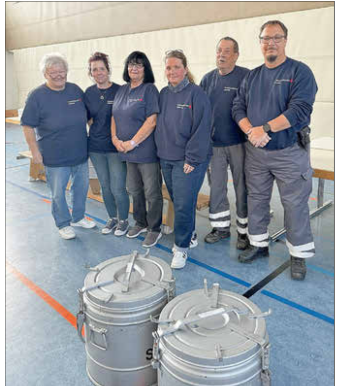
Das Kochteam vor der Ausgabe in der Halle

Durch die Gemeinde Rehlingen-Siersburg wurde am Sonntag, dem 26.10.2025 der Seniorennachmittag für den Gemeindebezirk Rehlingen in der Kultur- und Sporthalle in Rehlingen ausgerichtet. In diesem Jahr startete die Veranstaltung erstmalig mit einem Mittagessen. Der DRK OV Rehlingen-Siersburg kochte hierzu für die Teilnehmerinnen und Teilnehmer insgesamt 120 Portionen „Gefüllte mit Speckrahmsoße und Sauerkraut“.