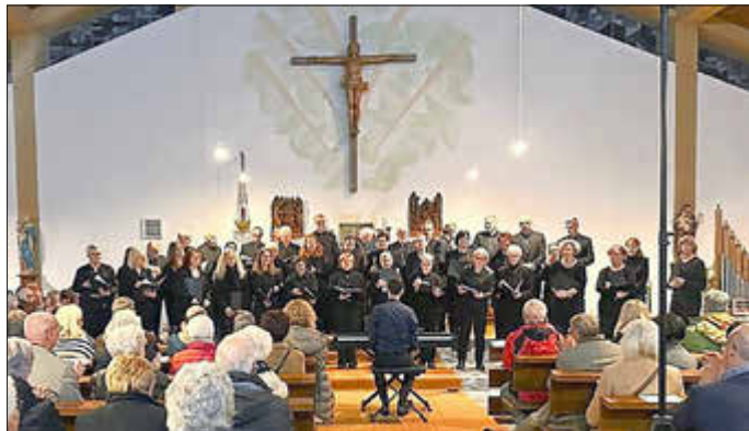
Der Chor beim Auftritt vor großem Publikum