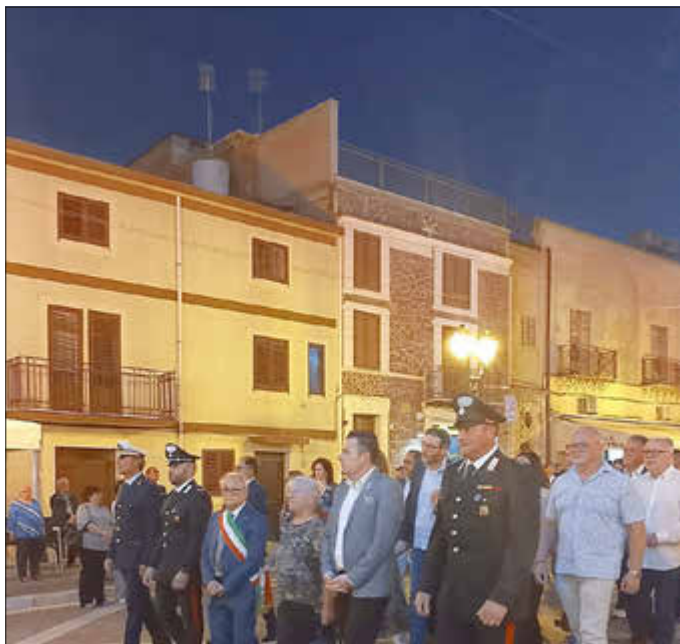
Am 25. September fand ebenfalls das Stadtfest der Namensgeberin statt. Neben der Prozession nahm die Delegation auch an der heiligen Messe teil

Mit der Unterzeichnung des Partnerschaftsvertrags mit Santa Caterina Villarmosa setzt Rehlingen-Siersburg ein weiteres Zeichen für Europa im Kleinen: für Freundschaft, Verständigung und eine gelebte europäische Gemeinschaft über Landesgrenzen hinweg. Mit den Partnerschaften mit Bouzonville und Santa Caterina Villarmosa macht sich Rehlingen-Siersburg, das im Herzen Europas liegt, stark für den europäischen Gedanken. Die Gemeinde bedankt sich daher bei allen, die sich in den letzten 50 Jahren für diese Freundschaften eingesetzt haben.