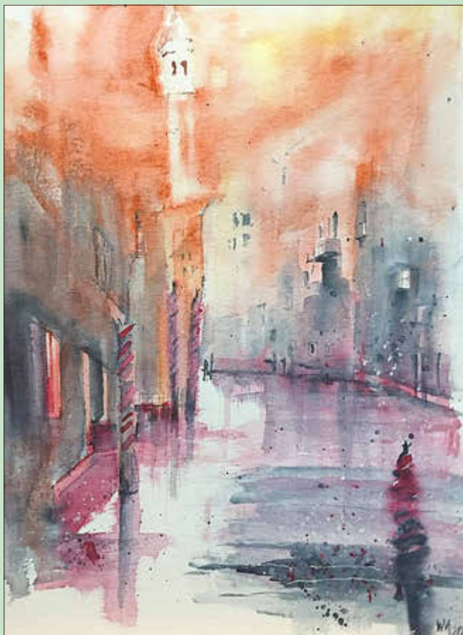
„Sommerhitze in Venedig“

Die Ausstellungseröffnung findet am Freitag, dem 14. November 2025, um 17 Uhr im Foyer des Sport- und Kulturzentrums statt. Alle Interessierten sind hiermit recht herzlich eingeladen.