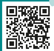
A.R.T. App für iPhone

Arzfeld, Dahlen, Daleiden, Daleiden - Neuhof, Eschfeld, Euscheid, Großkampfenberg, Harspelt, Heilhausen, Herzfeld, Hickeshausen, Irrhausen, Irrhausen-Eigelsfenn, Irrhausen-Heinischhof, Irrhausen-Mattelbach, Jucken, Kesfeld, Kickeshausen, Kickeshausen-Grünenseifen, Leidenborn, Lichtenborn, Lichtenborn Kopscheid, Lützkampen, Manderscheid, Neurath, Olmscheid, Reiff, Reipeldingen, Roscheid, Sengerich, Sevenig (Our), Strickscheid, Üttfeld