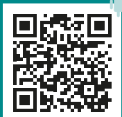
A.R.T. App für Android