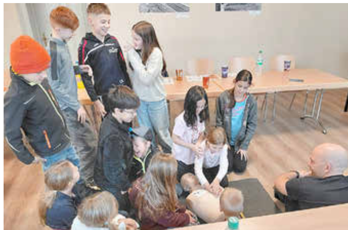
Unsere Jüngsten beim Erste-Hilfe-Kurs