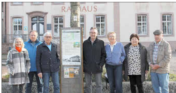
Die Mitglieder des AK Heimatkunde des HuVV vor der Infotafel am Rathaus