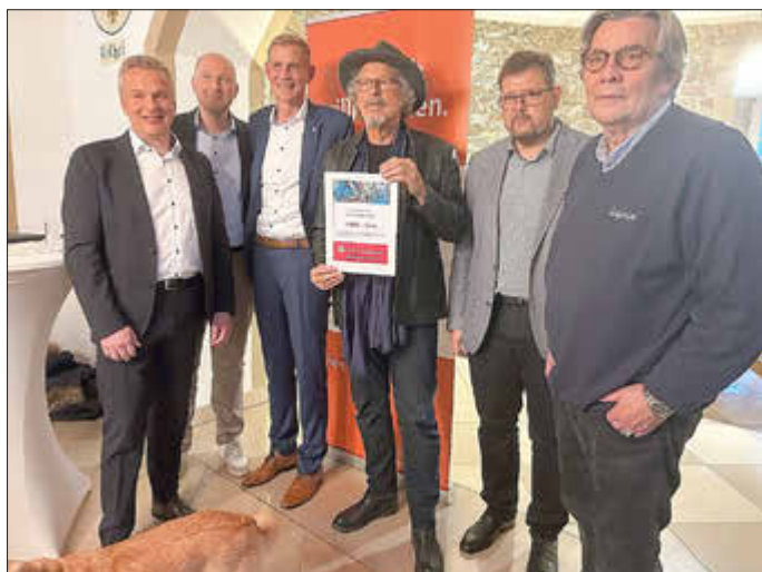
Übergabe des Schecks in Höhe von 5.000,- € der Kreissparkasse für den guten Zweck „Au secours du Congo“