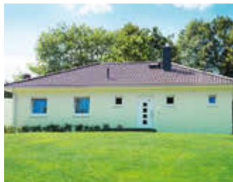
🏠 100 m 2 👤 6 🛏️ 3 🚿 1 SEEBLICK II