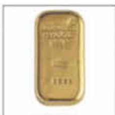
100 Gramm Gold