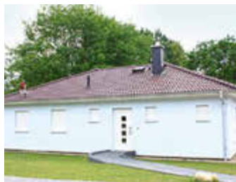
🏠 100 m 2 👤 6 🛏️ 3 🚿 1 SEEBLICK I