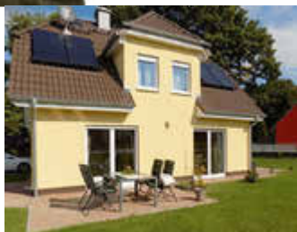
🏠 100 m 2 👤 4 🛏️ 2 🚿 2 SEESCHWALBE