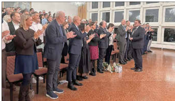
Applaus und Stehende Ovationen der Gäste