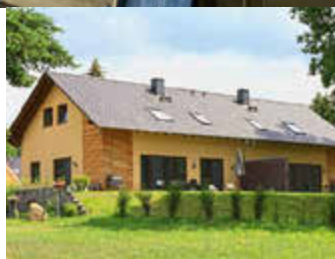
🏠 145 m 2 👤 6 🛏️ 3 🚿 2 AGA-SEEROMANTIK