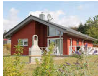
🏠 104 m 2 👤 6 🛏️ 3 🚿 2 TRINE