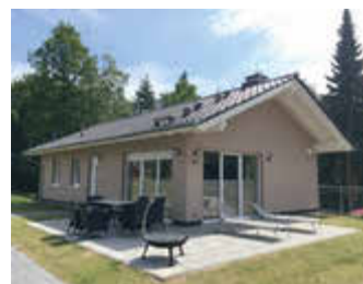
🏠 78 m 2 👤 4 🛏️ 2 🚿 2 KERSTIN