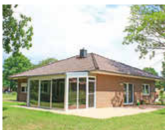
🏠 110 m 2 👤 4 🛏️ 2 🚿 1 DIANA