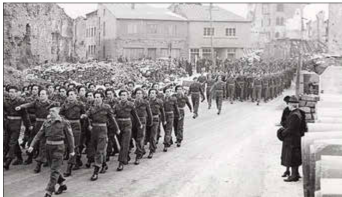
Das Foto stammt aus Bitburg (1949), Musée National d'Histoire Militaire (Diekirch), Fonds Aloyse Jacoby, K336_189.

Kriegsende 1945: Ganz Deutschland ist von den US-Amerikanern, Briten, Franzosen und Sowjets besetzt. Ganz Deutschland? Nicht ganz: In der Eifel stellen die Luxemburger die Besatzung. Von November 1945 bis Juli 1955 – für fast zehn Jahre – prägen die Soldaten aus dem kleinen Nachbarland das Bild der Altkreise Bitburg und Saarburg.