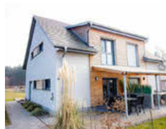
🏠 95 m 2 👤 6 🛏️ 3 🚿 2 ANITA