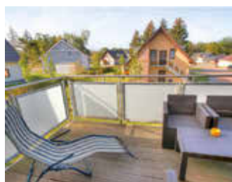
🏠 95 m 2 👤 4 🛏️ 2 🚿 1 OHANA DG