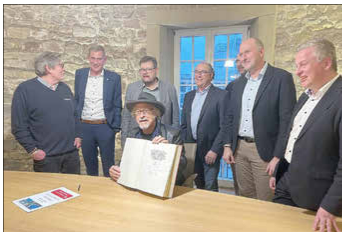
Eintrag von Wolfgang Niedecken in das Golden Buch der Stadt Bitburg

Das Bitburger Rathaus durfte am Donnerstag, den 26.09.2025 einen besonderen Gast begrüßen: Wolfgang Niedecken, Front-