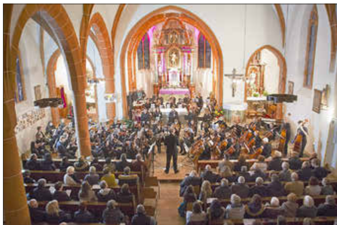
Das Sinfonieorchester der Kreismusikschule im Jahr 2018

Profis der Musikschule sind am 14. Dezember um 17:00 Uhr zu Gast