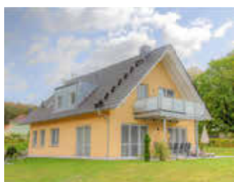
🏠 104 m 2 👤 4 🛏️ 2 🚿 1 OHANA EG