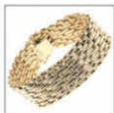
Armband 14 Karat

Bereits über 20.000 zufriedene Kunden in Düsseldorf, Aachen, Hannover, Moers, Dinslaken und Nordhorn haben diesen Service genutzt – nun ist „Bares4Wahres“ auch in Bitburg.