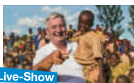
Live-Show mit Reiner Meutsch