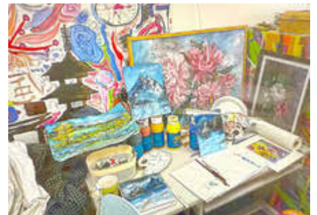
Einige der Arbeiten zum Tag der offenen Tür.