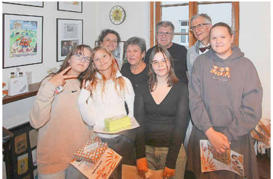
Abschlussbild mit den neuen Hörspiel-„Stars“.

Bis zur Fertigstellung vergingen fast sechs Monate. Für die Produktion mussten zusätzlich Geräusche im Schulkeller und auf der Straße hergestellt und aufgenommen werden. Das Experiment wurde schließlich ein voller Erfolg.