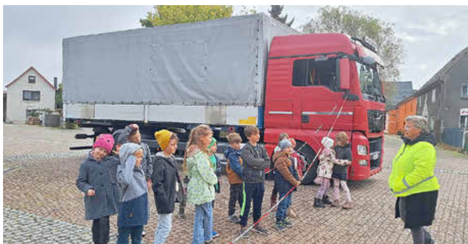
Die Schüler lernten am praktischen Beispiel, was der sogenannte „tote Winkel“ ist.

Am 7. Oktober folgte ein weiterer wichtiger Aktionstag: Der Kampagnen-Lkw der Verkehrssicherheit Berlin-Brandenburg (VSBB) machte Station auf dem Schulgelände. In kleinen Gruppen erfuhren die Kinder, was der sogenannte „tote Winkel“ ist und welche Gefahren damit verbunden sind. Jedes Kind durfte selbst auf dem Fahrersitz Platz nehmen und erleben, wie Mitschülerinnen und Mitschüler im toten Winkel verschwinden – eine eindrucksvolle Erfahrung, die das Bewusstsein für die Risiken im Straßenverkehr nachhaltig schärft. Die Schule dankt dem VSBB für die anschauliche und kindgerechte Durchführung des Verkehrssicherheitstags.