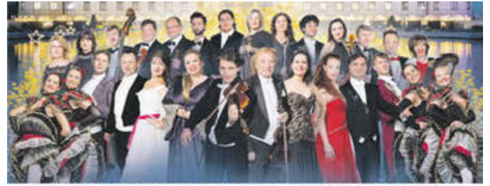
Mitglieder des GALA SINFONIE ORCHESTER Prag präsentieren