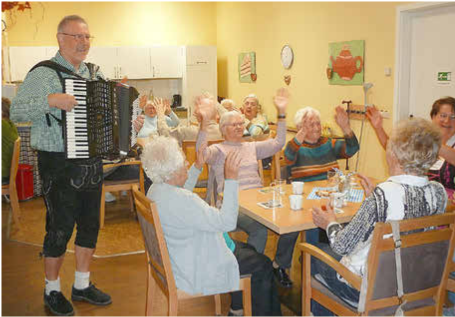
Die Oktoberfest-Zeit wurde auch in der DRK-Tagespflege Herzberg zünftig gefeiert.