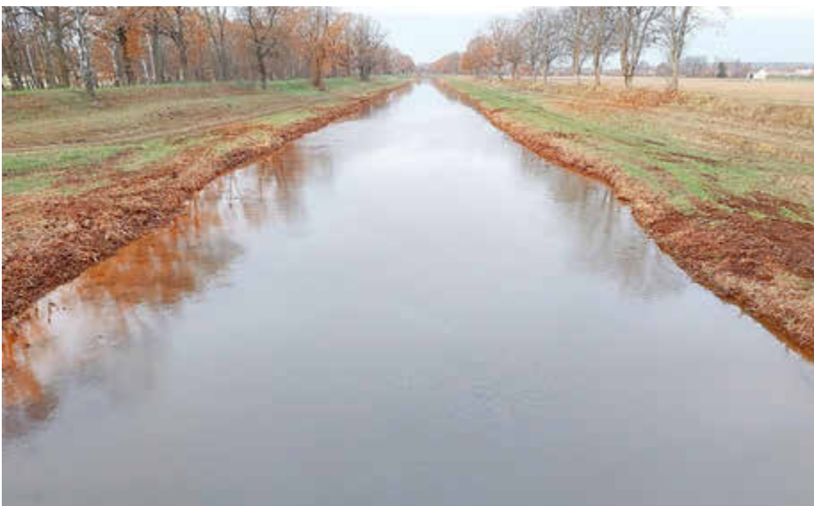
Begradigter Flusslauf der Schwarzen Elster zwischen Kahla und Elsterwerda im November 2024.

Wir sprechen über ein Vorhaben von mindestens zehn Jahren. Aber wir wollen nicht erst am Ende Ergebnisse sehen – sondern bereits in den kommenden Jahren erste sichtbare Verbesserungen erreichen. Die Region steht bereit, die Akteure arbeiten vernetzt, und der Bedarf ist unbestritten. Die Schwarze Elster war einst ein lebendiger, artenreicher Fluss. Unsere Aufgabe ist es, ihr diese Zukunft wieder zu ermöglichen – und damit auch unserer Landschaft, unserem Wasserhaushalt und den Menschen in der Region eine bessere Perspektive zu geben. (tho)