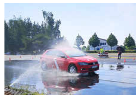
Die Teilnehmer lernen unter anderem, wie man sich bei einer Vollbremsung auf verschiedenen Straßenbelägen verhält.

in Kurven und bei einer Vollbremsung auf verschiedenen Straßenbelägen – sowohl trockenen als auch nassen – verhält. Interessenten können sich bevorzugt per E-Mail unter kreisverkehrswacht_ee@web.de oder telefonisch unter 03531 501901 (auch Anrufbeantworter; die Verkehrswacht meldet sich umgehend zurück) anmelden – sowie dienstags am Vormittag auch persönlich in der Geschäftsstelle der Kreisverkehrswacht in der Tuchmacherstraße 22 (Musikschule). Versicherte in Berufsgenossenschaften haben die Möglichkeit, einen Kostenzuschuss zu erhalten. Vor dem Weihnachtsfest kann man zudem einen Gutschein für das Fahrersicherheitstraining zum Verschenken erwerben. Darüber hinaus kann jeder – ob mit oder ohne Führerschein – auf dem Übungsplatz mit seinem Fahrzeug fahren: entweder vor dem Besuch der Fahrschule, um Kosten zu