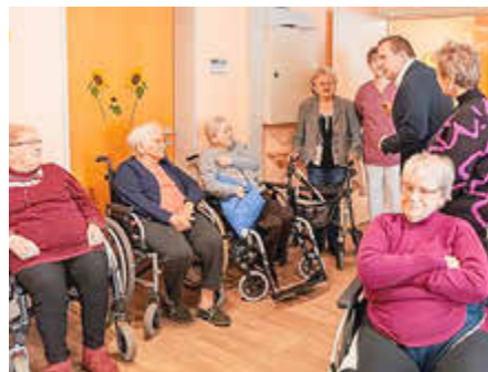
Landrat Christian Jaschinski nutzte die Gelegenheit um mit den Seniorinnen und Senioren ins Gespräch zu kommen.

Einen besonderen Akzent setzte der Besuch von Landrat Christian Jaschinski am Vormittag. Er nutzte die Gelegenheit, mit den Seniorinnen und Senioren ins Gespräch zu kommen, stellte interessierte Fragen und nahm sich Zeit für persönliche Anekdoten aus ihrem