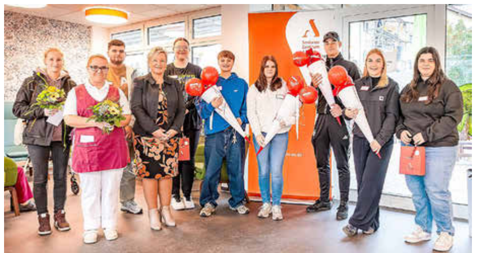
Neustart in die Zukunft der Pflege.

Auch die Teilnehmenden des Berufsvorbereitungsjahres wurden an diesem Tag offiziell willkommen geheißen und starteten in ihren neuen Abschnitt. Damit setzt das