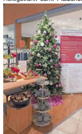
Mit einer Auswahl an außergewöhnlichem und buntem Christbaumschmuck lädt Mode Zörgiebel bereits zur dritten Christbaumkugel-Aktion ein, diesmal zugunsten des zweieinhalbjährigen Neos.

Ein Besuch bei Mode Zörgiebel lohnt sich im Advent also in vielerlei Hinsicht. Hier finden sich nicht nur neue Lieblingsstücke für die kommenden Festtage, es gibt auch zahlreiche Geschenkideen, darunter beispielsweise Dekoratives und Praktisches für den gedeckten Tisch von der Firma Räder. Selbstverständlich werden alle Einkäufe auch gleich vor Ort liebevoll verpackt, während man an der Kaffeearbeit ein Heißgetränk samt Plätzchen und Lebkuchenspezialitäten aus der Beerfurter Schokoladenmanufaktur Eberhardt genießen und sich eine kleine Auszeit gönnen kann. Darüber hinaus ist Mode Zörgiebel auch während des Crumbacher Weihnachtsmarktes am Samstag, den 13. Dezember, von 10 bis 18 Uhr ein lohnendes Ziel. Weitere Informationen sind telefonisch unter 06164-2099 bzw. im Internet unter www.zoergiebel.de erhältlich.