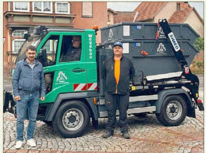
Neben einem neuen Multicar wurden in 2025 weitere Fahrzeuge für den Bauhof angeschafft

Erste Neuanschaffungen ersetzen die in die Jahre gekommene Bauhoftechnik - Ökumenischer Haseltal-Gottesdienst - Generationenwechsel im Feuerwehrverein Steinbach-Hallenberg e.V. - Neue zentrale und gemeinsame Grünschnittannahmestelle im Gewerbegebiet „Im Erlich“ - Landrätin Peggy Greiser besucht die Firma Tillmann Verpackungen Schmalkalden GmbH - Der 1. Schdaaimicher Frühling mit verkaufsoffenem Samstag und Flohmarkt mit Pflanzenbörse im Museum ziehen viele Besucher an - Ausverkauftes Haus beim Konzert vom Chor B-Ware in der Stadtkirche - Neue Bäume für die Stadt: Am Bahnhof, in der Kita Haseltal und am Schwimmbad - 125 Jahre Rathaus: am 26. März 1900 wurde der Grundstein für das heutige Rathaus gelegt - Kita-Kickoff: die Haseltaler Stadtmeisterschaften für kleine Fußballer - Babyempfang mit 30 Neugeborenen: 14 Mädchen und 16 Jungen wurden im Rathaus begrüßt - Luca Anding vom SC Steinbach-Hallenberg wird in Östersund Vizeweltmeister mit der deutschen Biathlon-Jugendstaffel