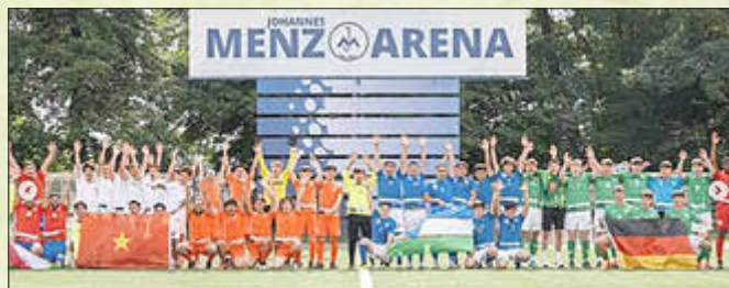
Viel Internationalität und Fair-Play beim 1. Food-Ball-Cup