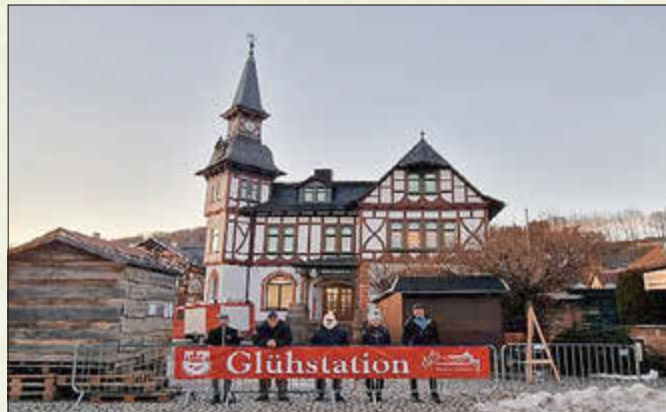
Die Glühstation vor dem Rathaus

Klangschalenkonzert in der Kirche Oberschönau - Die Glühstation vom Feuerwehrverein Steinbach-Hallenberg heizt den Gästen vom Biathlon-Weltcup in Oberhof vor dem Rathaus ein - Gagenkarneval: Gala und Prinzenkaffee der Viernauer Karnevalisten - 10. Schdaaimicher Chreesöpfelwürcher auf der Spielwiese - Unter der Überschrift „Erwecke das Fernweh in dir“ finden im Metallhandwerksmuseum Reiseberichte von Namibia, Sardinien und den USA statt - Allianzgebetswoche unter dem Motto: Miteinander füreinander - Erste Präventionsveranstaltung für Senioren in Kooperation mit der Polizei - Die neue Website der Touristinfo geht online - Konstituierende Sitzung des 2. Kinder- und Jugendbeirates - 11. Entdeckungsreise für Berufswelten für 124 Siebt- bis Neuntklässler und 20 Unternehmen aus dem Haselgrund