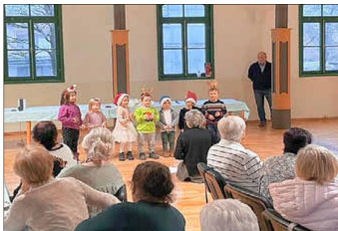
Auftritt der Meilerwichtel bei der Seniorenweihnachtsfeier in Bermbach

Der begeisterte Applaus des Publikums ließ nicht lange auf sich warten, sodass die kleinen Künstler sogar mehrere Zugaben geben konnten. Die Meilerwichtel konnten sichtlich stolz auf ihre gelungene Darbietung sein und trugen maßgeblich zum Erfolg der Veranstaltung bei.