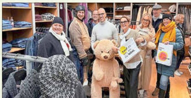
Bereit für die 7. Schdaaimicher Einkaufsnacht bei AbigMode

„O'zapft is“ beim Oktoberfest in Unterschöna - 1. Modellbahnausstellung der IG Modellbahnfreunde Haseltal im evang. Kindergarten - Viele Besucher zur 7. Schdaaimicher Einkaufsnacht 2025 -