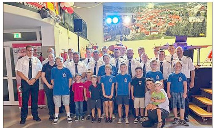
Die Viernauer Feuerwehr sagt Danke: Freiwillige Feuerwehr, Feuerwehrverein und Jugendfeuerwehr bedanken sich für die große Unterstützung anlässlich der 150-Jahr-Feier.

Zahlreiche Unternehmen aus Viernau und dem Haselgrund unterstützten uns mit Sach- und Geldspenden, darunter die Rennsteig Werkzeuge GmbH, die AWP Metall- & Kunststofftechnik GmbH, die Höhn Handelsgesellschaft mbH sowie viele weitere lokale Firmen, deren Beiträge unser Jubiläum maßgeblich ermöglichten.