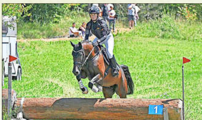
Die Geländeprüfungen in der Wuhlheide sind immer die Höhepunkte des Pferdesport-Wochenendes

Schachclub Rochade Steinbach-Hallenberg erreicht historischen 2. Platz in der Landesklasse - vielseitiges Sportfest in Altersbach - 1. Senioren-Frühscoppen im Freibad begeistert über 100 Besucher - Neue Technik für den Bauhof - Flexibilität, Weitblick und regionale Stärke beim Unternehmensbesuch von AWP GmbH - Präzision trifft Kreativität beim Unternehmensbesuch von KNCP in Oberschöna - Bunte Sommerfeste in den Kindertagesstätten - 2. Ostdeutsche Meisterschaften der Vielseitigkeitsreiter in Viernau