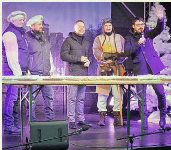
Die Stollenspende der Bäckerei Marr zum 31. Adventsfest vor dem Rathaus brachte 1.000 Euro für den Bürgerbus ein

2. Eröffnung der Haselpipe - Weihnachtsmarkt in Oberschönau auf dem Festplatz - 125 Jahre Kirche in Unterschönau mit Festgottesdienst - 31. Adventsfest vor dem Rathaus - Adventskonzert mit dem Posaunenchor, dem Kirchenchor und dem Kinderchor der Evangelischen Kirchengemeinde und dem Frauensingkreis Rotterode - Straßenbaumaßnahme Friedhofsgasse in Steinbach-Hallenberg - Kauf eines Firmengebäudes im Gewerbegebiet „Stiller Berg“ als Standort für einen Zentralbauhof - Buchpräsentation „Si komme, Si komme“ zu 80 Jahre Kriegsende von und mit Tanja König, Paul Marr und Wolfgang Diller - Schäferweihnacht in der Kirche Altersbach - 2. Moosbachtaler Glüewiifäst