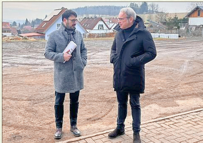
Bürgermeister Markus Böttcher und Innenminister Meier besprechen die Situation zum Feuerwehrgerätehaus in Bernbach

Der 1. Seniorenbeirat wird gewählt - Winterpicknick mit Schneegarantie auf dem Knüllfeld im Rahmen der Mitmachkirche - Wirtschaftsjuvenen-Stammtisch in der Waldgaststätte Am Köpfchen - Laienspielgruppe des Fördervereins Heimathof mit neuem Namen = „Spiel-lust“ - Besuch von Innenminister Georg Meier in Bernbach - Bundestags- und Bürgermeisterwahl: Markus Böttcher (Pro8) mit 54,9% erneut zum Bürgermeister von Steinbach-Hallenberg gewählt - Sonne satt beim Karnevalsumzug der Gagen in Viernau