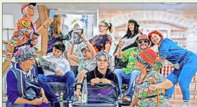
Lientheater „Spiellust“ bei der Premiere ihrer neuen Komödie

Die Baumpflanzchallenge kommt ins Haseltal und sorgt für jede Menge Spaß und viele neue Bäume in der Region - Kirmes in Herges-Hallenberg - Das Hotel „Zur Hallenburg“ wird wiedereröffnet - HLSK Gerlach unter den Top 10 beim MuT-Preis der IHK Südthüringen - Stadtratsbeschlüsse zur Einstellung des Skiliftbetriebes in der „Kniebreche“ und zum Bau eines neuen Feuerwehrgerätehauses in Bermbach - Schdaaimicher Kirmes auf der Spielwiese - Tag des offenen Denkmals im Metallhandwerksmuseum - 3. Inliner Parcours Challenge des SC Steinbach-Hallenberg - Kirmes in Viernau auf dem Gemeindeplatz - Delegation des 40. Ohrdruffer Schmiedesymposiums zu Besuch im Metallhandwerksmuseum - Festveranstaltung 150 Jahre Freiwillige Feuerwehr Viernau - Ping-Pong-Kirmes in Rotterode - Landrätin Peggy Greiser besucht die Unternehmen Möbel König, Pflegedienst Schenk und Abig Moden - 9. Hallenburg Cup im Schach - zwei ausverkaufte Veranstaltungen des Lientheaters „Spiellust“ - 26 neue Erdenbürger beim Babyempfang vom 1. Halbjahr 2025