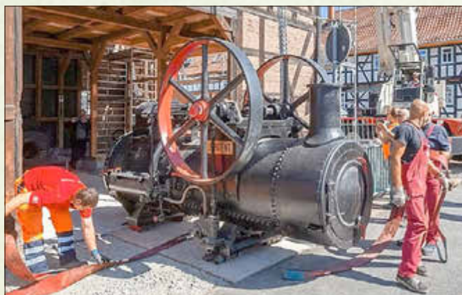
Rückkehr der restaurierten Dampfmaschine

Kermes in Oberschöna - Bürgerfest in Altersbach - Abschied von der Kindertagesstätte „Moosbachtal Kids“ in Rotterode - Haseltalzeltlager der Jugendfeuerwehren - 1. Food-Ball-Cup: Fußball, internationales Buffet und Fairplay vereint - Firmenlauf Thüringens Süden: 10 Teams aus dem Haselgrund sind mit dabei - Sommerkino auf dem Knüllfeld - Viernau feiert die Rückkehr von Dampfmaschine & Sägegatter an den ursprünglichen Ort - Einweihung des Barfußpfades für die Sonnenkinder von Oberschöna & die Kita Haseltal & Hergeser Springmäuse bekommen neue Spielgeräte - 200 Jahre Sparkasse in der Region & 30 Jahre Rhön-Rennsteig-Sparkasse - 120 Jahre Skiclub Steinbach-Hallenberg mit Sommerfest