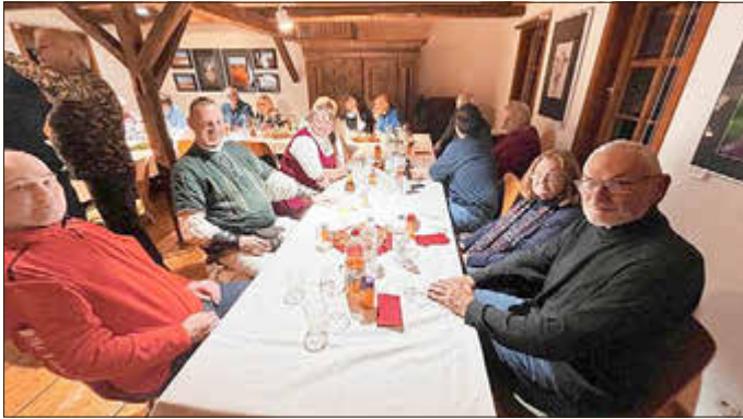
Viele Ehrenamtliche bereichern mit ihrem Engagement das Leben im Metallhandwerksmuseum.

Bilder, kurze Beiträge und persönliche Anekdoten zeichnen ein lebendiges Bild eines erfolgreichen Jahres - geprägt von neuen Projekten, beliebten Veranstaltungen und wertvoller gemeinschaftlicher Arbeit.