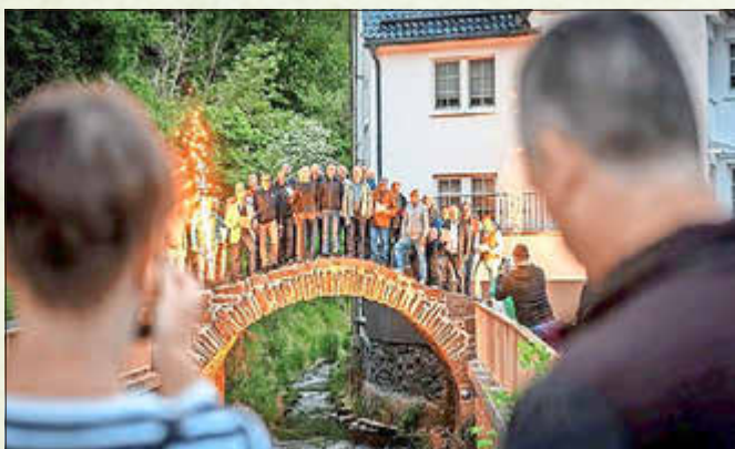
„Hohe Brücke“ Unterschönau: Abenddämmerung, Chorgesang und Feuerwerk

Traditioneller „Tag der offenen Tür“ der Freiwilligen Feuerwehr Steinbach-Hallenberg - Ab sofort können Personalausweise und Reisepässe nur noch mit digitalen Passbildern beantragt werden - 30-jähriges Jubiläum des Kegelvereins „Gut Holz“ Haseltal - vier ausverkaufte Vorträge im Rahmen der Sonderausstellung „Si komme, Si komme“ im Metallhandwerksmuseum - Ein Jahrhundert Mut, Einsatz und Bereitschaft: 100 Jahre Freiwillige Feuerwehr Bermbach - Trotz Nieselregen war der Museumstag mit Kunsthandwerkermarkt und Frühlingfest im Metallhandwerksmuseum gut besucht - ThüringenCup im Turnier-Hundesport am Hundesportplatz Stiller Berg - Unterschönau in Aktion: Dorffest, 140 Jahre Freiwillige Feuerwehr, 35 Jahre Bergwaldprojekt und 5 Jahre Zukunftswald - Feier am Kulturerbe Hohe Brücke - mit Chor, Einweihung der Infosteile und kleinem Feuerwerk -