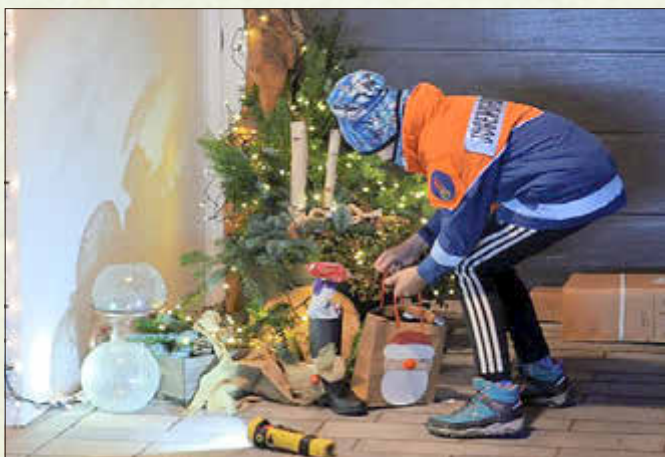
Die Nikolausaktion der Haseltalfeuerwehren erfreute 480 Kinder in allen Ortsteilen

Fest der Wertschätzung im Metallhandwerksmuseum für alle ehrenamtlichen Helfer - 3. Bermbacher Marktglöhen - Nikolausaktion der Haseltalfeuerwehren für 480 Kinder -