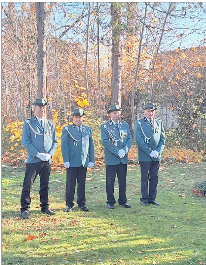
Mitglieder der Schützengilde Elsterwerda 1843 e.V.