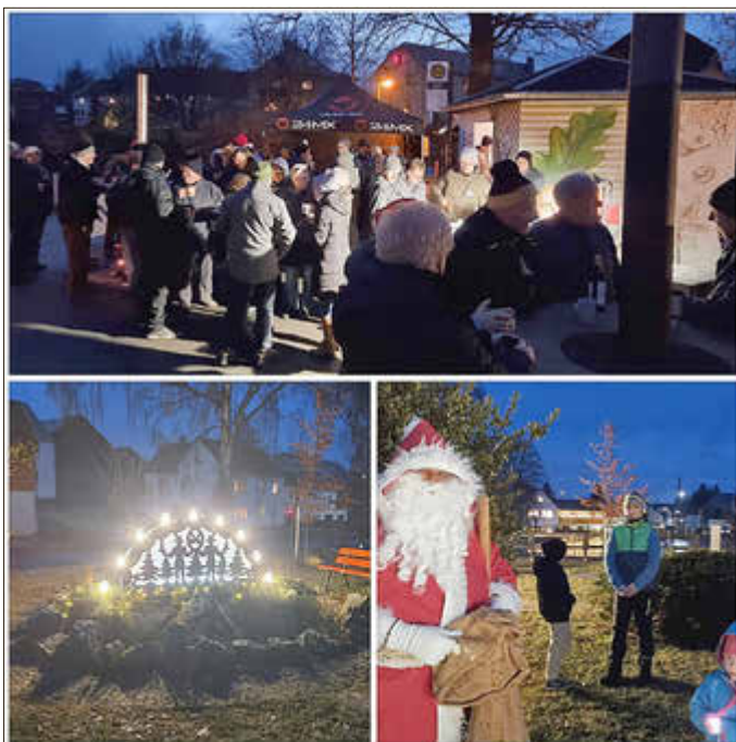
Dorfverein Ranspach e.V.

Schon jetzt darf man sich freuen – auch im nächsten Jahr soll es wieder einen Adventsauftakt am Brunnen hinter dr Wooch geben. Ein Termin, den man sich vormerken sollte!