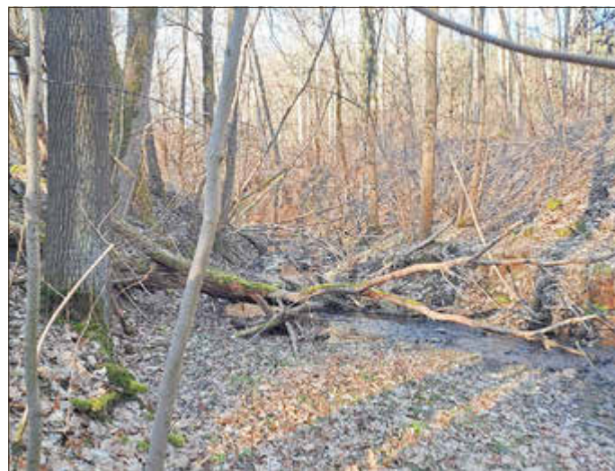
Flussholz ist ein wertvoller Lebensraum und sollte in der freien Landschaft möglichst im Gewässer bleiben.

Bei einem Spaziergang am Bach sieht man manchmal abgebrochene Äste, freigespülte Wurzelballen oder sogar einen vom letzten Sturm umgewehten Baum, der jetzt im Wasser liegt. Was hat es damit auf sich - mit diesem Holz im Bach? Kann das bleiben oder muss das weg?