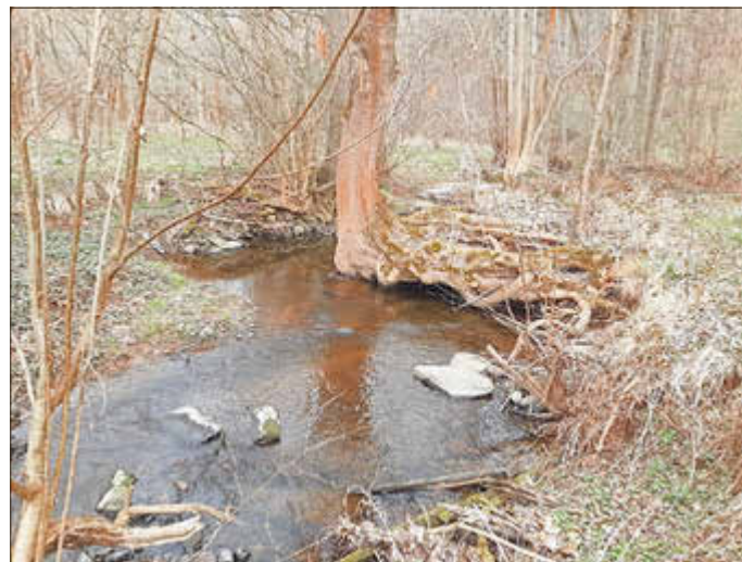
Foto: Dieser Baum ist ein perfekter Unterstand für Fische und kann vor Fressfeinden schützen und im Sommer Abkühlung bringen

Dieser Text entstand in Zusammenarbeit der Fachberaterinnen und Fachberater Gewässer des Landesamtes für Umwelt, Landwirtschaft und Geologie und der unteren Wasserbehörde des Landkreises.