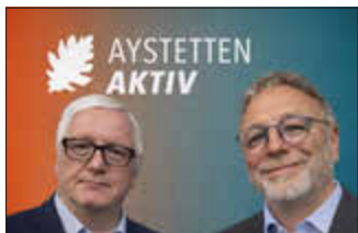
Die Vorsitzenden des Vereins Aystetten aktiv