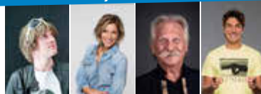
Mickie Krause, Anna-Maria Zimmermann, Henning Krautmacher und Comedian Matze Knop