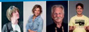
Mickie Krause, Anna-Maria Zimmermann, Henning Krautmacher und Comedian Matze Knop