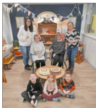
Leitungsteam und Zeitzeugen stoßen auf das Jubiläum an

Während der Vorbereitung der Kommunalwahlen und im Zusammenhang mit dem komplexen Wohnungsbau in der Stadt der Aluminiumarbeiter, wurde der Bau einer Kindereinrichtung diskutiert. In den Volkswirtschaftsplan eingeordnet, wird dieser große Wunsch im Jahr 1984 verwirklicht. In der Lauter Bachstraße entsteht eine Kombination mit Krippen- und Kindergartenplätzen, welche bis Ende 1985 fertiggestellt wurde und am 04.02.1986 eröffnete.