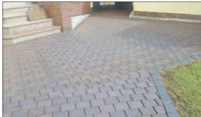
und nach unserer Steinsanierung