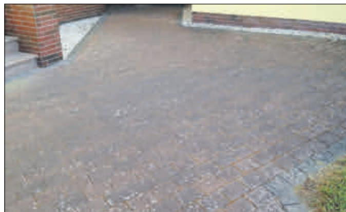
Die gepflasterte Fläche vor ...

Informationen im Internet unter www.martin-bausanierung.de oder Telefon 02772/581995