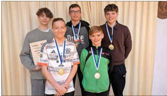
Die stolzen Sieger in der Schüler- und Jugendklasse.