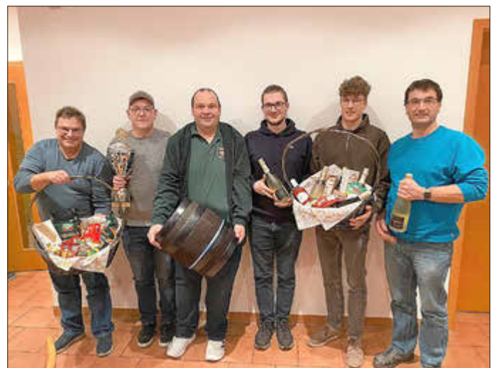
Bei der Übergabe des Wanderpokals und der Sachpreise zeigten sich die Bestplatzierten der diesjährigen Dorfmeisterschaft sichtlich erfreut.

Ein herzlicher Dank gilt allen, die sich durch ihre Teilnahme und tatkräftige Unterstützung an der Dorfmeisterschaft beteiligt haben. Besonders bedanken wir uns beim Gockel-Team für die ausgezeichnete Bewirtung.