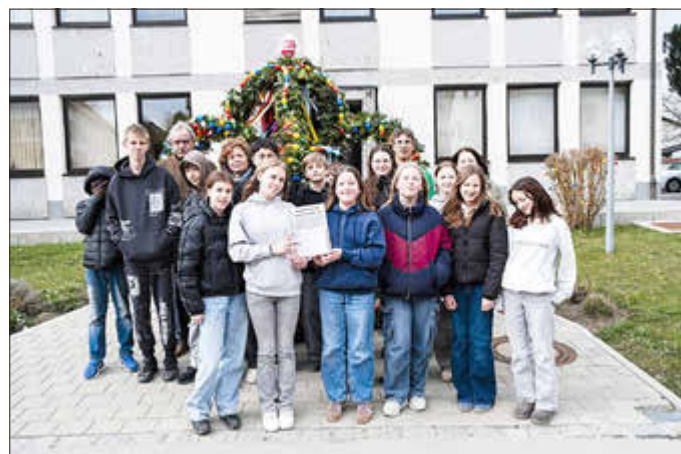
Die Sonne strahlt mit den Siebtklässlern um die Wette und im Hintergrund wartet der Fischacher Osterbrunnen auf seine Vollendung.