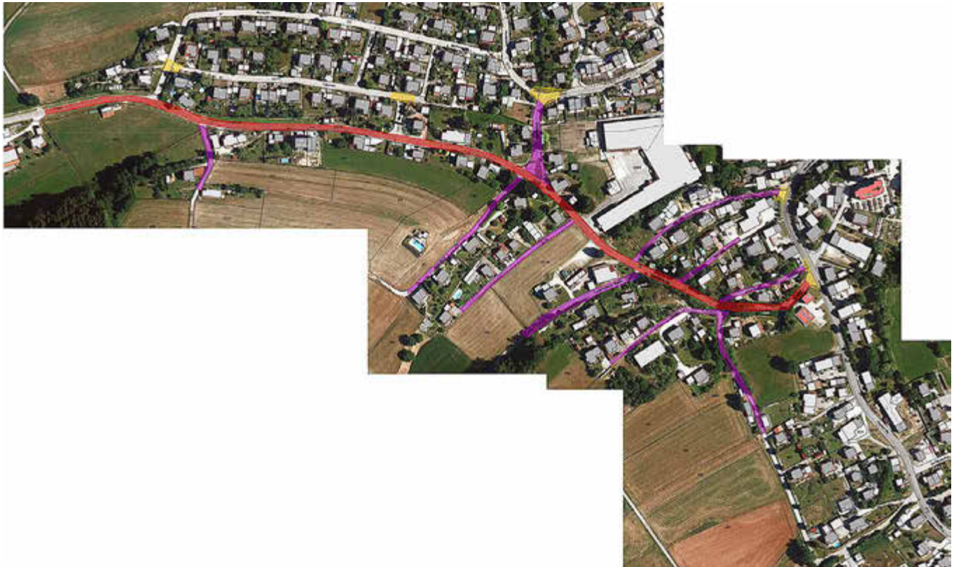
Die Sammelpunkte sind durch gelb markierte Stellen gekennzeichnet.