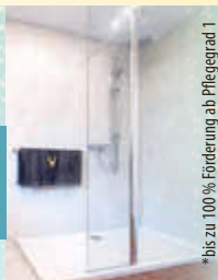
*bis zu 100% Förderung ab Pflegegrad 1

Badewanne zur begehbaren Dusche in 24 Stunden.*