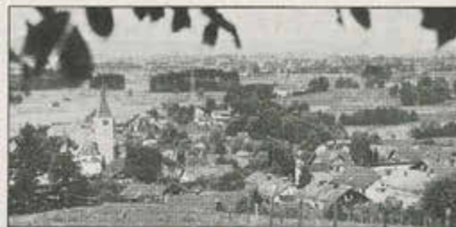
Vermutlich ist die Gemeinde Haldenwang etwa 1000 Jahre alt, urkundliche Erwähnung fand sie jedoch erstmals anno 1180. Auf die damalige Zugehörigkeit zum Kloster Ottobeuren verweist auch heute noch das Gemeindegewapp, dessen zweite Hälfte an den Wappenschild der Ritter von Wagegg erinnert. Ab dem Ende des 17. Jahrhunderts gehörte Haldenwang ebenso wie Börwang zum Stift Kempten.