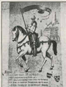
Der Ritter Walther von Wagegg zielt eine Wunde in die alte Börwanger Schule.

Damit die Bürger auf ihrem schönen neuen Platz Feste feiern können, wurde beim Rathaus-Bau auch an eine kleine Küche und eine behindertengerechte Außentoilette gedacht.