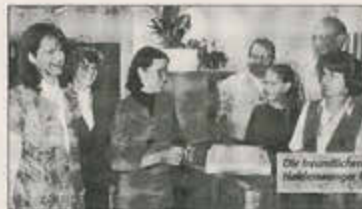
Die hiesigen Mitarbeiter im Haldenwanger Rathaus.