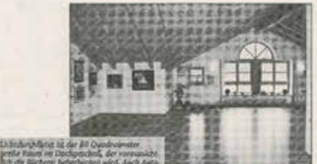
Eintragungs-Merkmal ist der 80 Quadratmeter große Raum im Dachgeschoss, der konventionell für die Bücherei beherbergt wird. Auch Außenanlagen und andere kulturelle Veranstaltungen können hier stattfinden.

Finden außerhalb der Rathaus-Öffnungszeiten Sitzungen oder kulturelle Veranstaltungen statt, so sind die Räume im Dachgeschoss über einen separaten Einlass zu erreichen.