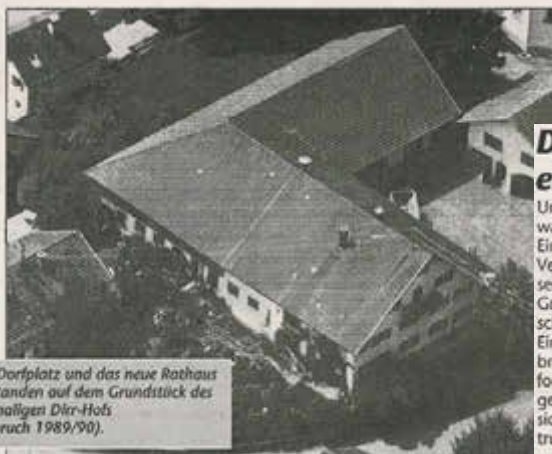
Der Dorfplatz und das neue Rathaus entstanden auf dem Grundstück des ehemaligen Dirr-Hofs (Abbruch 1989/90).

Noch in diesem Herbst wird mit der Aufstockung und Erweiterung des Feuerwehrhauses in Börwang begonnen. Bereits in naher Zukunft sollen auch die Haldenwanger Floriansjünger ein neues Domizil erhalten.