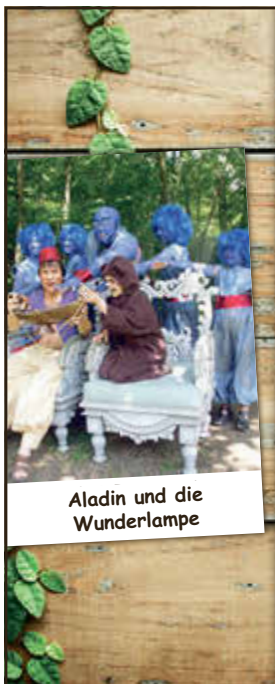
Aladin und die Wunderlampe