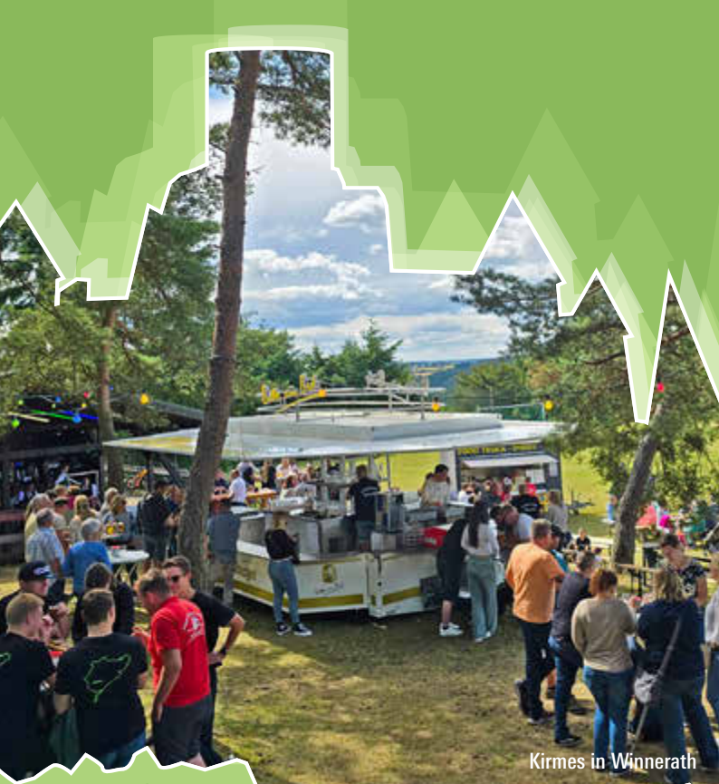
Kirmes in Winnerath