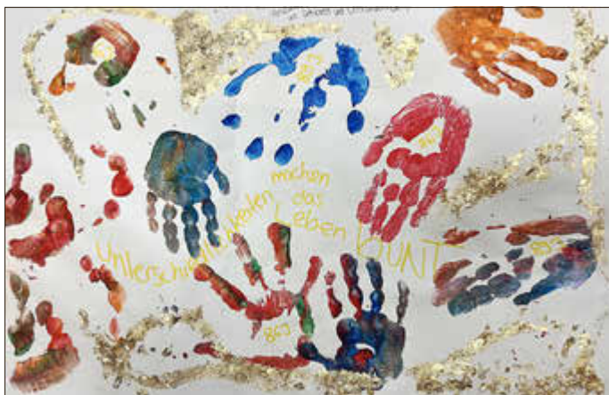
Eine sonnige Zeit, wünscht das Team der Kita „Wäller Schatzkiste“

Unterschiedlichkeiten machen das Leben bunt.