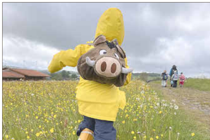
Das Eichhörnchen-Team Lesen Sie bitte weiter auf Seite 10.