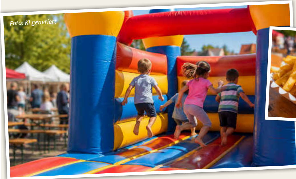
Foto: KI generiert