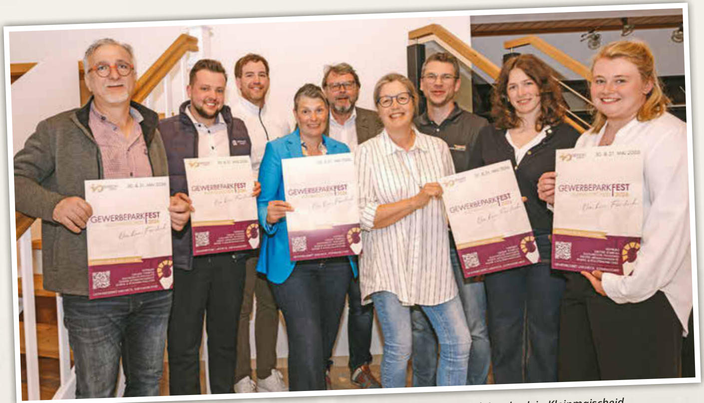
Das Organisationsteam freut sich auf ein lebendiges Gewerbeparkfest 2026 im Gewerbepark Larsheck in Kleinmaischeid.

ZWEI TAGE VOLLER EINBLICKE, BEGEGNUNGEN UND REGIONALER STÄRKE