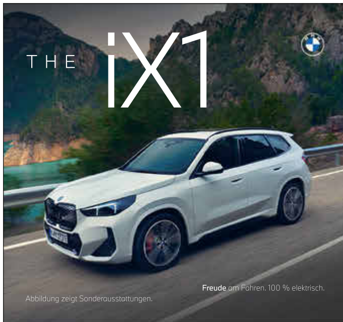
Abbildung zeigt Sonderausstattungen. Freude am Fahren. 100 % elektrisch.