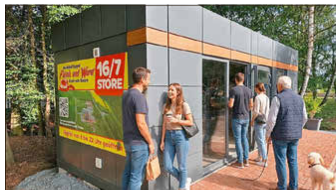
Kunden sind begeistert von dem neuen Konzept Heidehof Fleisch und Wurst-Store 16/7.

Heidehof Sippel eröffnet 16/7 Store an der Hessenhalle 4