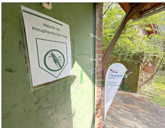
Heupferdchentag am Alten Bahnhof Trais-Horloff