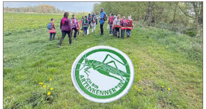
Die NAJU Gruppe bei der Frühlingswanderung

Die Prüfungssituation war für alle Beteiligten spannend. Am Ende des Vormittags konnten die vier Kinder in einem feierlichen Rahmen stolz ihre Urkunden sowie die Heupferdchen-Aufnäher entgegennehmen.