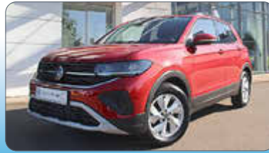
VW T-Cross Life 1.0 TSI DSG

Ausstattung: Panorama-Ausstell-Schiebedach, Parkassistent, Travel Assist, 230-V-Steckdose, Rückfahrkamera, Digital Cockpit, Progressivlenkung