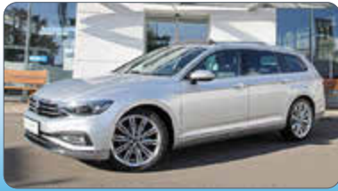
VW Passat Variant Elegance 2.0 TDI DSG