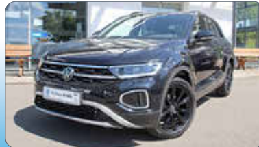
VW T-Roc Black Style 1.5 TSI DSG

Ausstattung: Licht- u.-Sicht-Paket, App-Connect, Air Care Climatronic, Spurhalteassistent „Lane Assist“, Neuwagenanschlussgarantie bis zum 20.03.29 oder bis 100.000 km