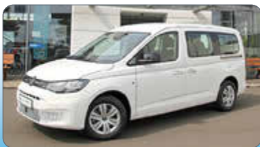
VW Caddy Maxi 1.5 TSI

Ausstattung: Spurhalteassistent, Verkehrszeichenerkennung, App-Connect Wireless, LED-Matrix-Scheinwerfer, Dynamischer Fernlichtassistent