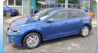
VW Polo Style 1.0 TSI DSG

Ausstattung: „Anhängervorrichtung anklappb., App-Connect Wireless, Rückfahrkamera „Rear View“, Verkehrs.-Erkennung, Spurhalteassistent, Ausparkassistent, LED-Scheinw.