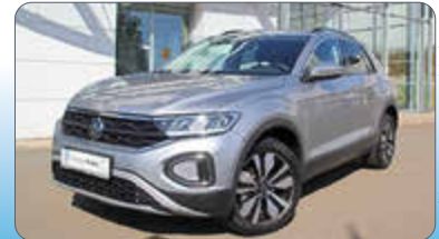
VW T-Roc Move 1.0 TSI

Ausstattung: Sportfahrwerk, Sprachbedienung, Rückfahrk. „Rear View“, Anhängervorrichtung abnehmbar, Standheiz. mit Fernbedienung, Digital Cockpit Pro