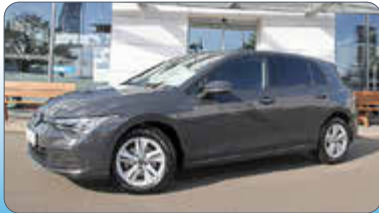
VW Golf VIII Life 1.0 TSI

Ausstattung: Fahrprofilausw., Verkehrszeichenerk., Rückfahrkamera „Rear View“, Panorama-Ausstell-/Schiebedach, Digital Cockpit Pro, Neuwagenanschlussgarantie bis zum 08.08.29 oder bis 100.000 km