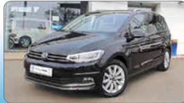
VW Touran Highline 2.0 TDI DSG

Ausstattung: Fernlichtregulierung, Regensensor, Spurhalteassistent, LED-Scheinwerfer, App-Connect Wireless, Digital Cockpit Pro,