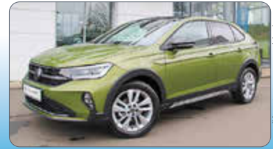
VW Taigo MOVE 1.5 TSI DSG

Ausstattung: LED-Scheinw., Verkehrszeichenerk., Rückfahrkamera „Rear View“, App-Connect-Wireless, „Lane Assist“, Neuwagenanschlussgarantie bis zum 30.06.29 oder bis 100.000 km