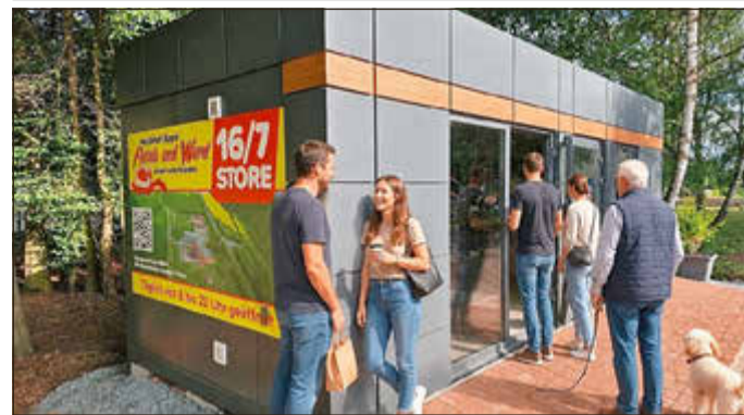
Kunden sind begeistert von dem neuen Konzept Heidehof Fleisch und Wurst-Store 16/7.